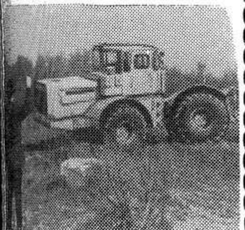
ЛЕНИНГРАД. Недавно государственная комиссия приняла модель трактора «К-701» и рекомендовала Кировскому заводу приступить опытно-партию этих машин для проведения эксплуатационных испытаний. НА СНИМКЕ: «К-701» проходит ходовые испытания.

ЦЕНТРАЛЬНЫЙ КОМИТЕТ КОММУНИСТИЧЕСКОЙ ПАРТИИ СОВЕТСКОГО СОЮЗА