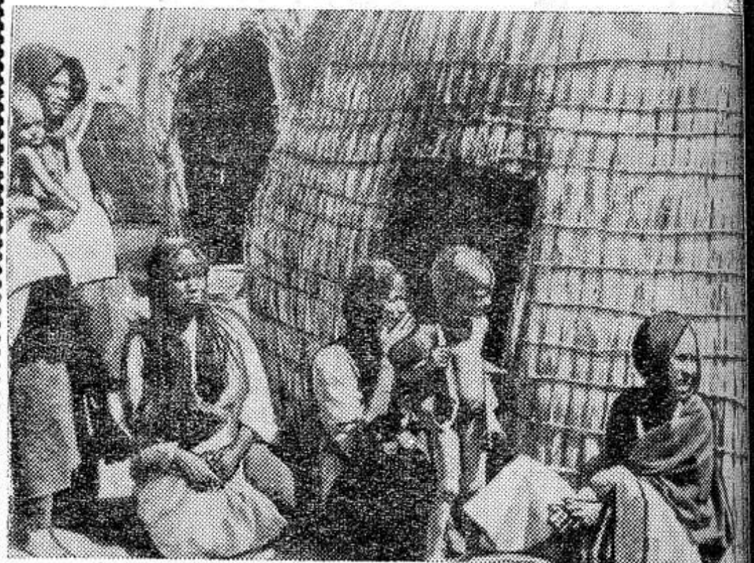
Нигер — государство, расположенное в Центральной Африке. Значительная часть его территории до сих пор не исследована. Основу экономики составляют животноводство и выращивание архариса.