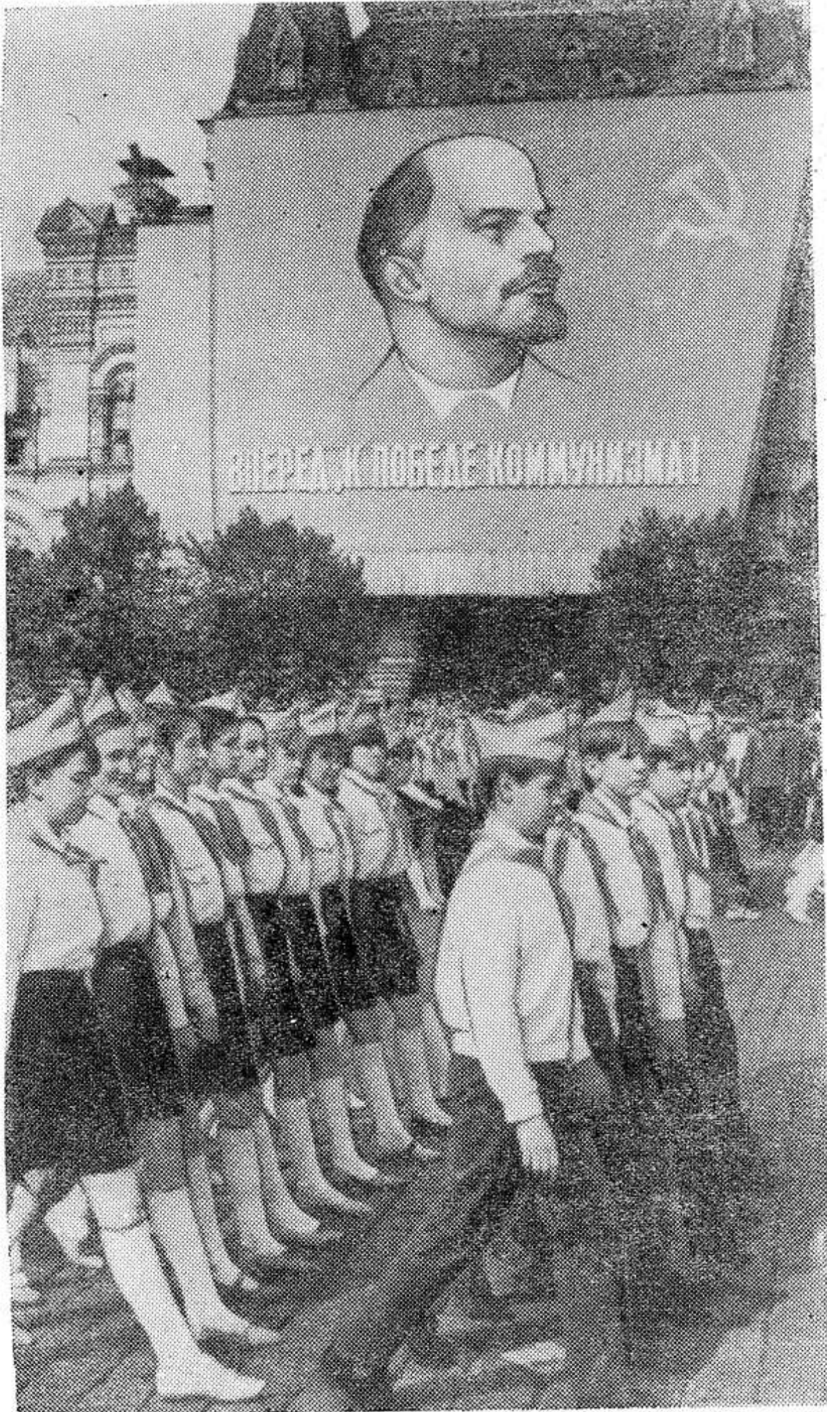
На снимке: парад юных ленинцев на Красной площади в Москве.