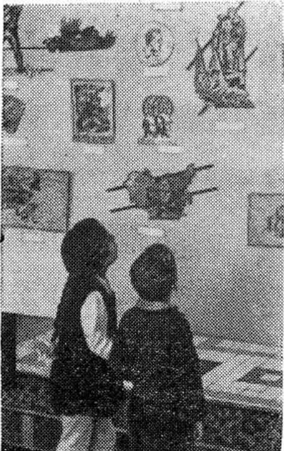
В Курске открыта областная выставка детского изобразительного творчества. На ней представлено более двухсот работ школьников из городов Львова и Курска, Хомутовского, Фатежского и других районов области. Лучшие произведения будут направлены на юбилейную художественную выставку в Москву. НА СНИМКЕ: юные ценители искусства.