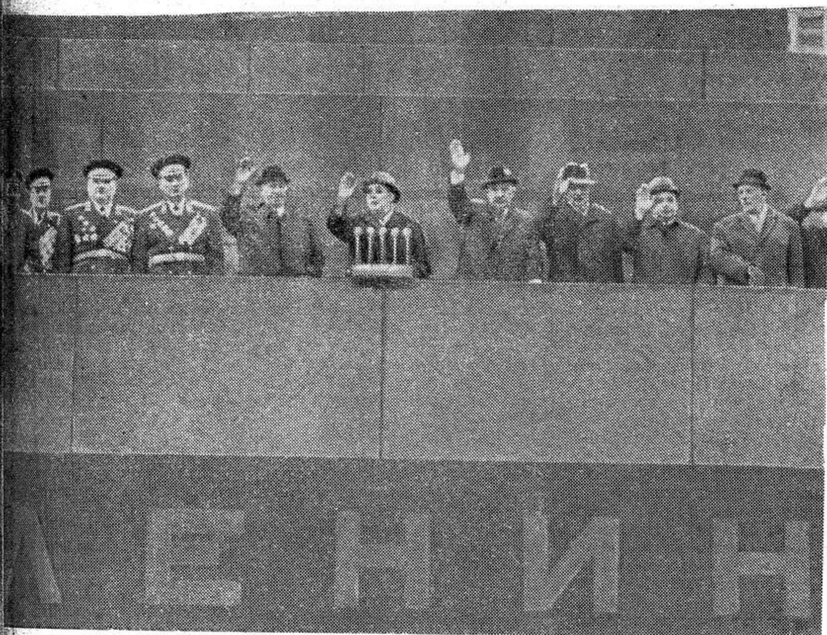
Демонстрация представителей трудящихся на Красной площади. НА СНИМКЕ: на трибуне Мавзолея В. И. Ленина.

Праздничные митинги и демонстрации в честь Дня международной солидарности трудящихся — 1 Мая — состоялись также в Ленинграде, Киеве, Минске, Ташкенте, Алма-Ате, Тбилиси, Баку, Вильнюсе, Кишиневе, Риге, Фрунзе, Душанбе, Ереване, Ашхабаде, Таллине, Владивостоке, Хабаровске, Южно-Сахалинске, Нальчике, Липецке, Саратове, Оренбурге, Череповце и других городах и селах страны.