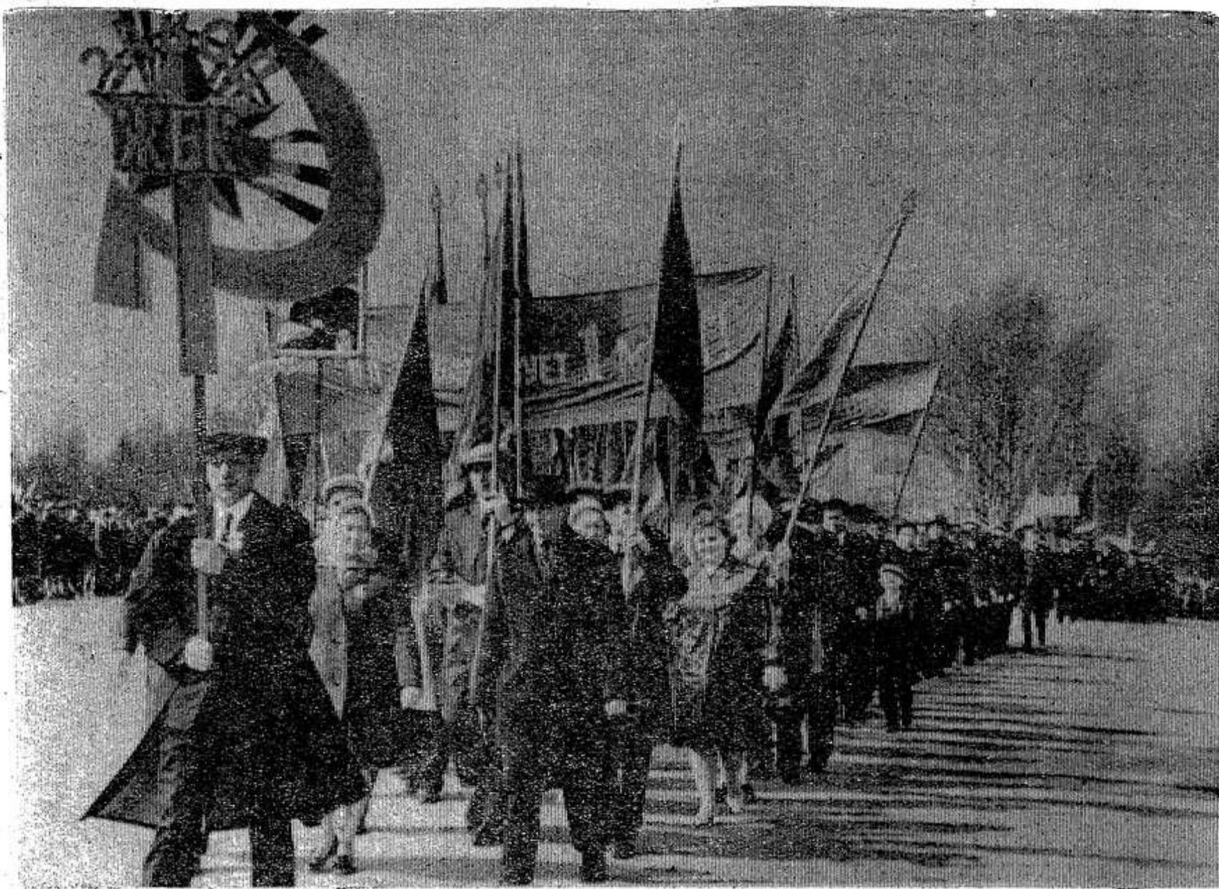
НА СНИМКАХ: первомайская демонстрация в Опочке.