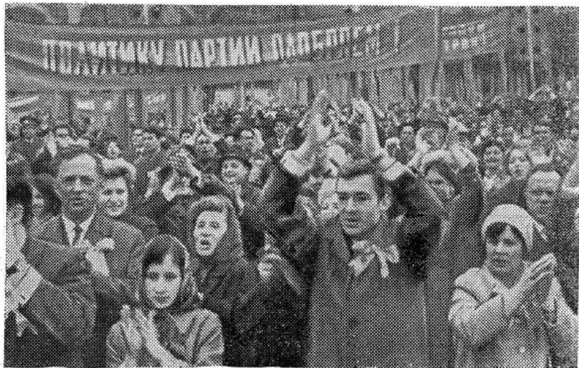
Во время торжественного митинга на Красной площади. Фотохроника ТАСС.

В обрамлении алых стягов проплывает изображение ордена «Победа». Перестраиваются кумачовые ряды, и на седой брусчатке пламенеет звезда. Время расступается перед памятью истории: в центре звезды поднимается, оживает монумент