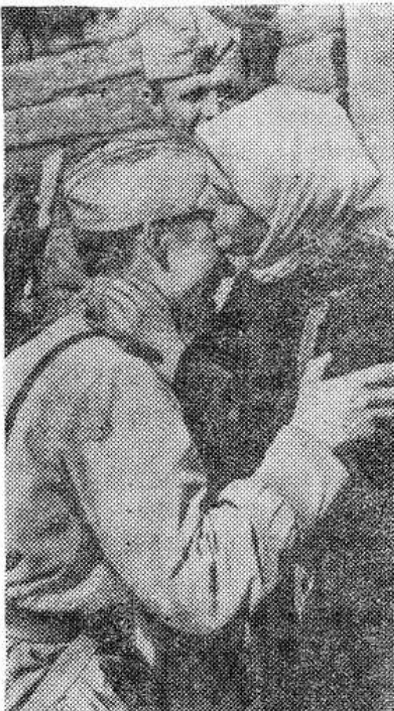
Ельнинское направление, август 1943 года.

К нам пришла весна. А вместе с нею горячая пора полевых работ. Мы ждем от рабселькоров, читателей газеты писем, заметок, рассказывающих о трудовых делах коллективов, отдельных тружеников, о людях хороших.