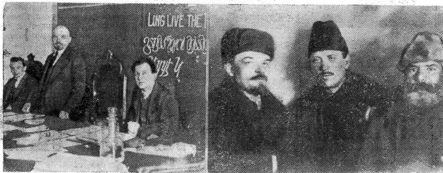
В. И. Ленин в президиуме I конгресса Коминтерна в Кремле. Слева направо: Г. Эберлейн,