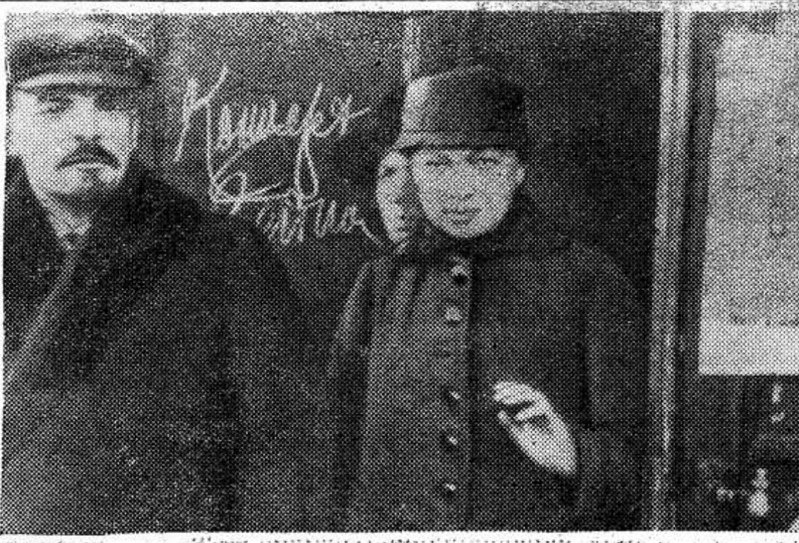
В. И. Ленин и Н. К. Крупская выходят из Дома союзов после заседания I Всероссийского съезда по внешкольному образованию. Москва, 6 мая 1919 года.

С. Воловский соб. корр. АПН Гаага, март.