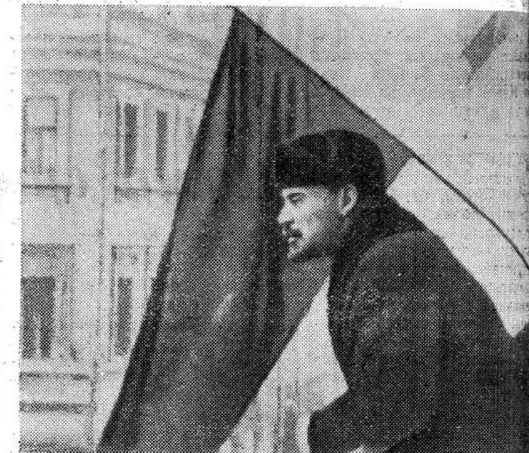
В. И. Ленин выступает с балкона Моссовета с приветствием бойцам-коммунистам, отходящим на борьбу с фашизмом. Москва, 16 октября 1919 года.