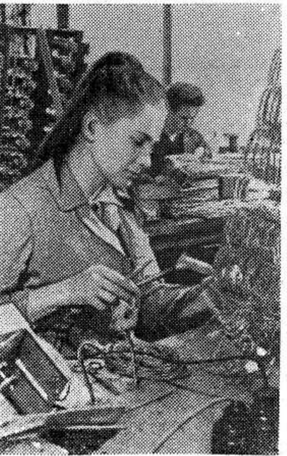
Польша. На заводе телевизионной аппаратуры в Быдгоще монтируют небольшие автоматические телефонные станции, предназначенные для сельской местности. Эти установки чрезвычайно удобны, так как гарантируют бесперебойную работу круглые сутки в отсутствие оператора.

Большой и сложной задачей гражданской обороны является организация и проведение спасательных и неотложных аварийно-восстановительных работ