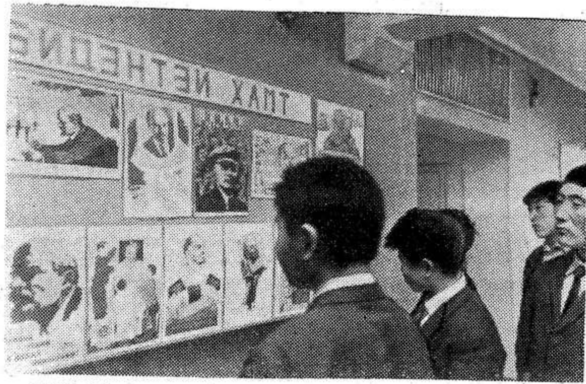
МНР. Недавно в небольшом городке Баянчандмань открылось профессионально-техническое училище, которое готовит специалистов для сельского хозяйства страны. Здание училища построено с помощью СССР и оборудовано всем необходимым для теоретических и практических занятий. Училище ежегодно будет выпускать 600 специалистов для села.

Кроме того, в Новой Гуте находится крупнейший металлургический комбинат, носящий имя великого гения революции. Построенный с братской помощью Советского Союза, он дает более 40 процентов всей стали, выплаваемой в Народной Польше. Комбинат — прекрасное олицетворение успешного претворения ленинских заветов.