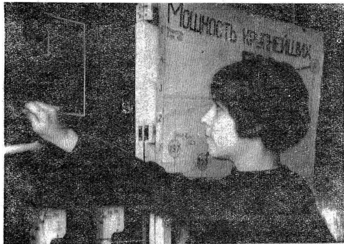
Третий год Опочечкое профессионально-техническое училище готовит специалистов-строителей. За это время училище окончили 320 юношей и девушек. Они работают сейчас в Пскове и районах области. В настоящее время в училище занимается 210 человек. Это