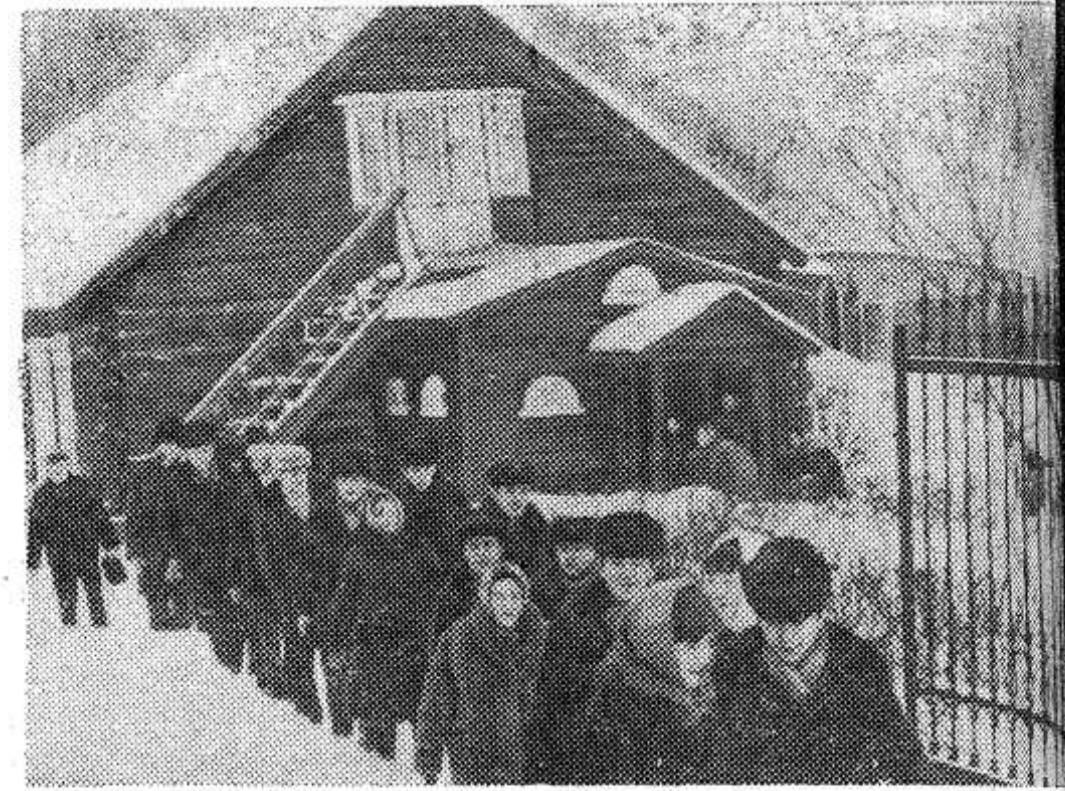
ТАТАРСКАЯ АССР. Дом-музей В. И. Ленина в деревне Кокушкино ежегодно посещают 60-70 тысяч человек. Здесь в 1887-88 годах Владимир Ильич отбывал наказание за свое первое революционное выступле-