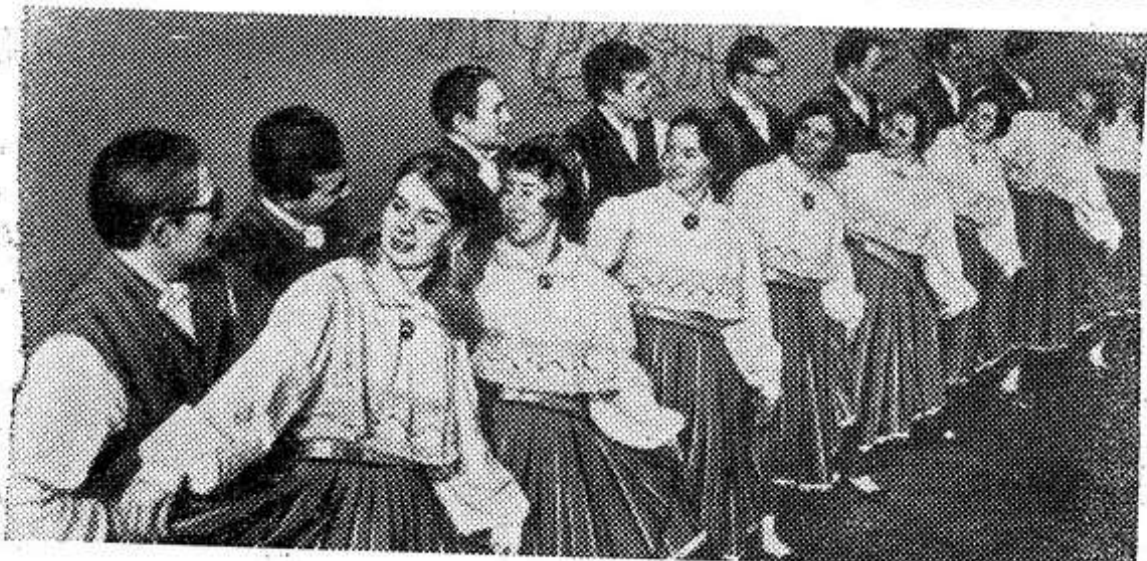
ЭСТОНСКАЯ ССР. Свыше десяти тысяч самодетельных артистов примут участие нынешним летом на празднике народного танца. Из Хаапсалуского района в столицу республики приедут 16 танцевальных кружков, в их числе и ансамбль рыболовецкого колхоза имени Нахимова. Его участников вы видите на этом снимке.