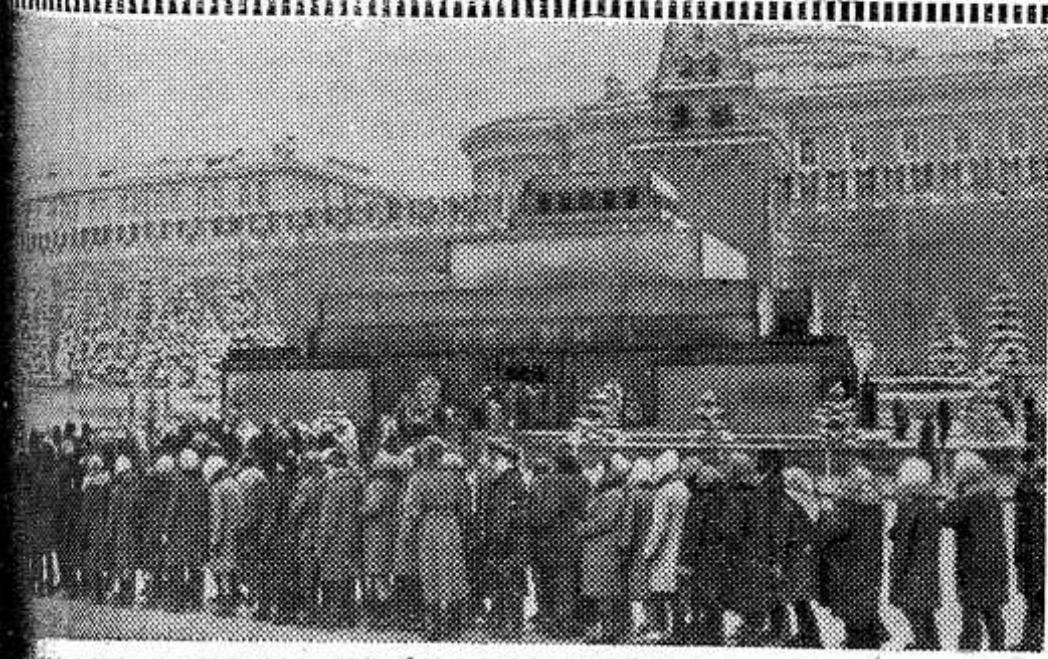
МОСКВА. Красная площадь. Январь 1970 года. У Мавзолея И. Ленина.