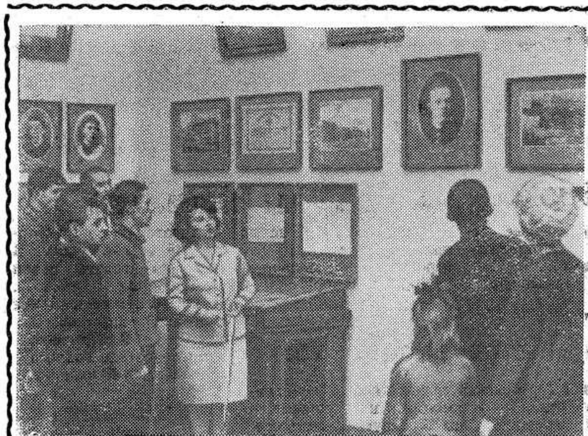
МОСКВА. Центральный музей В. И. Ленина после капитального ремонта и обновления экспозиции снова распахнул свои двери перед москвичами и гостями столицы.

В принятом постановлении намечены меры по улучшению контроля и исполнения принимаемых решений.