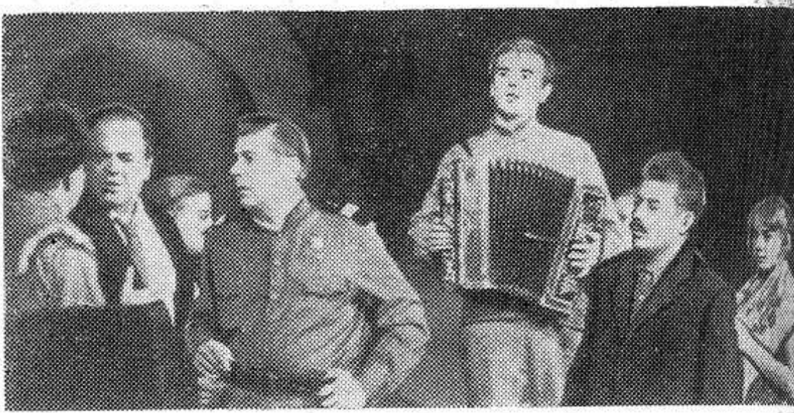
Московский драматический театр на Малой Бронной показал премьеру пьесы Леонида Леонова «Золотая карета». Действие пьесы происходит вскоре после войны в небольшом городке. Автор утверждает в ней идеи советского гуманизма. НА СНИМКЕ: сцена из спектакля.