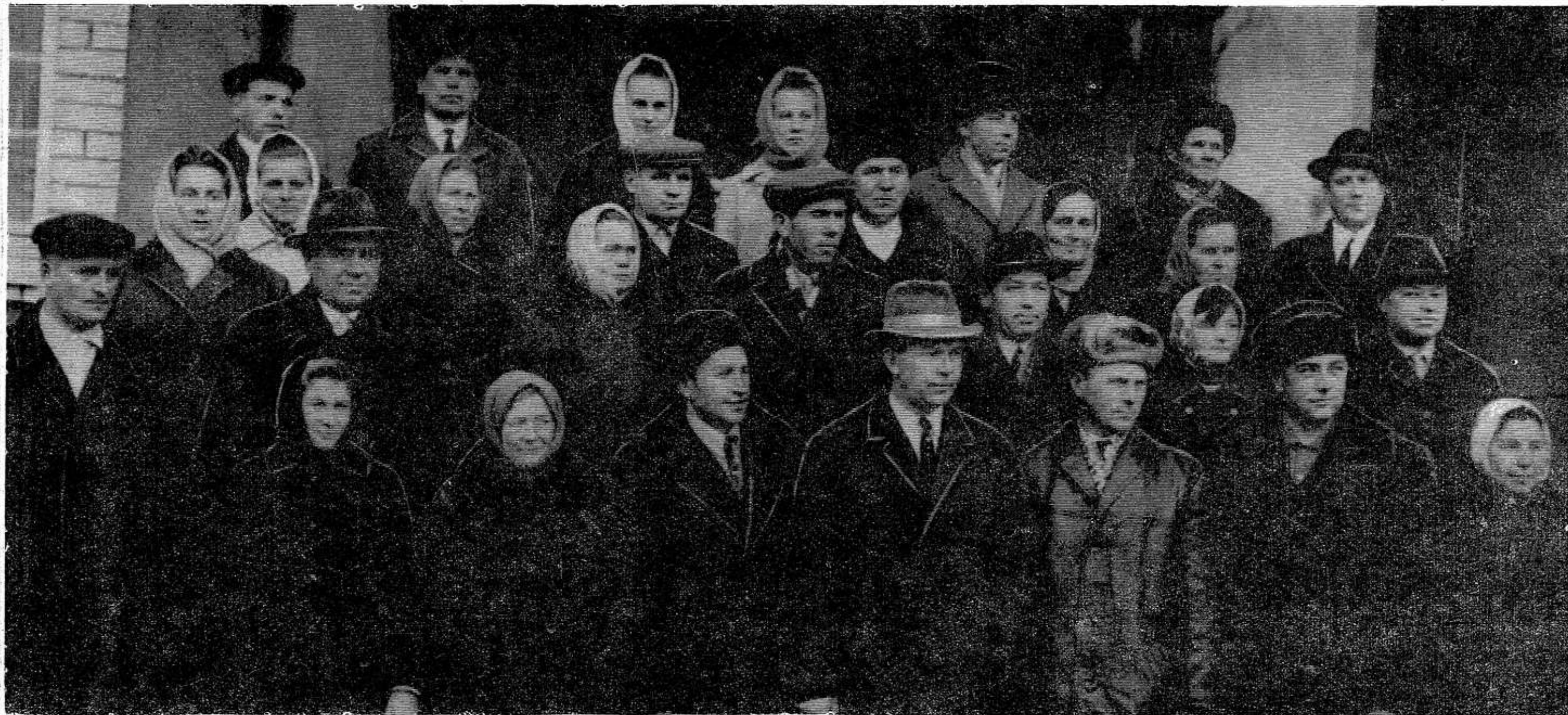
НА СНИМКЕ: наша делегация, принявшая участие в работе областной конференции колхозников