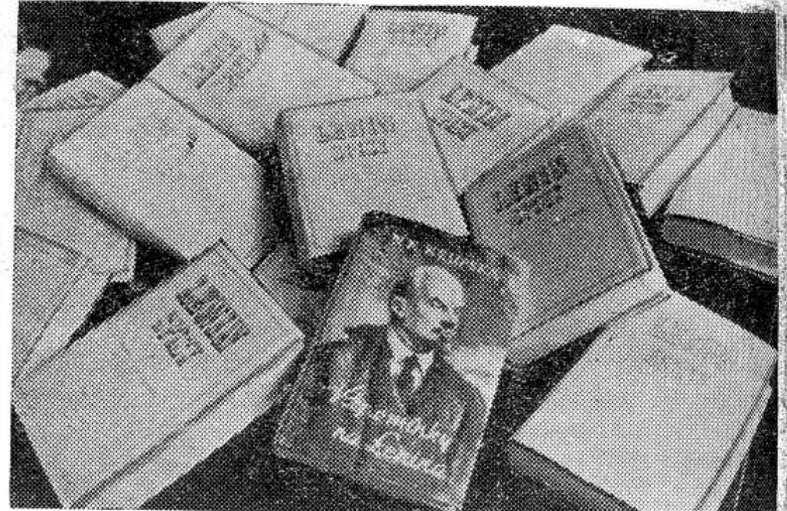
В социалистической Чехословакии большими тиражами издаются произведения В. И. Ленина, воспоминания о нем. В 1970 юбилейном году будет завершён выпуск полного собрания Сочинений великого вождя революции. НА СНИМКЕ: труды В. И. Ленина и книга Н. К. Крупской «Воспоминания о Ленине», изданные в ЧССР.