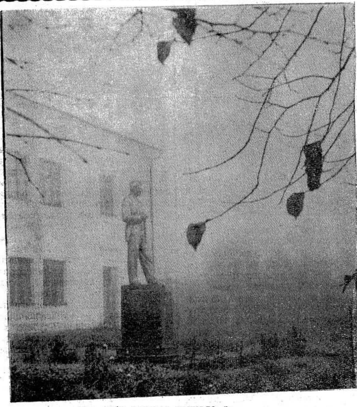
«Уж небо осенью дышало...».

ВРЕМЯ от времени, просматривая на досуге старые блокноты, я всякий раз нахожу страничку с записью этой истории. Истории грустной и исключительной. Именно исключительной, потому что встречается подобное в наши дни весьма редко. Так стоит ли рассказывать об этом? Исключение есть исключение, государство у нас огромное, счет во всем идет на миллионы, и так ли уж важна грустная, исключительная история? Вот именно — важна! И в миллионном счете не должен теряться отдельный человек. Важно, чтобы в каком-то далеком селе не плакала по ночам старушка, оскорбленная дочерью, не омрачалась душа человека, которому пусть всего пять лет от роду... АВТОР.