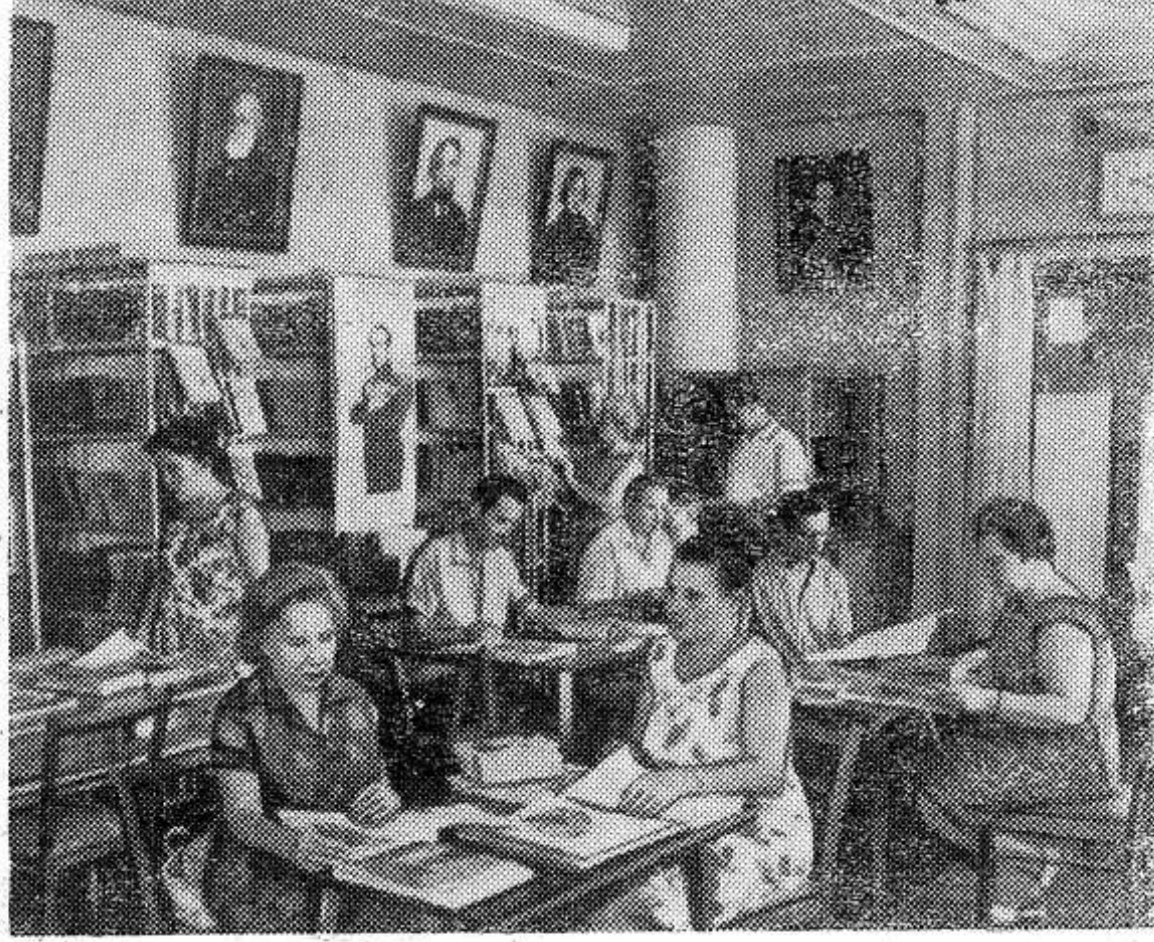
Ставропольский край. Санаторий Центросоюза — одна из многочисленных здравниц бальнеологического курорта Ессентуки. Ежегодно здесь лечатся и отдыхают тысячи кооператоров. Для этого в санатории созданы благоприятные условия — отлично оснащены врачебные и процедурные кабинеты, в уютных палатах и холлах много света и воздуха, есть библиотека. На снимке: отдыхающие в библиотеке санатория.