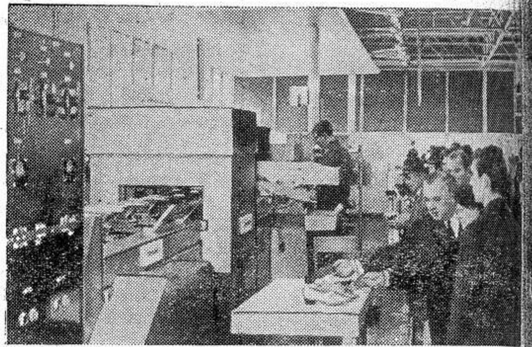
В Москве открыта международная выставка «Обувь-69». Впервые на этой выставке в советском разделе машины и оборудование демонстрируется полуавтоматическая линия ПЛК-0, предназначенная для производства обуви клееного метода крепления. Обработка обуви производится на металлических колодках, закрепленных на площадках, обеспечивающих транспортировку колодки от операций к операциям. На линии выполняются все операции по изготовлению обуви производительностью — 85 пар в час. На снимке: посетители осматривают линию ПЛК-0.