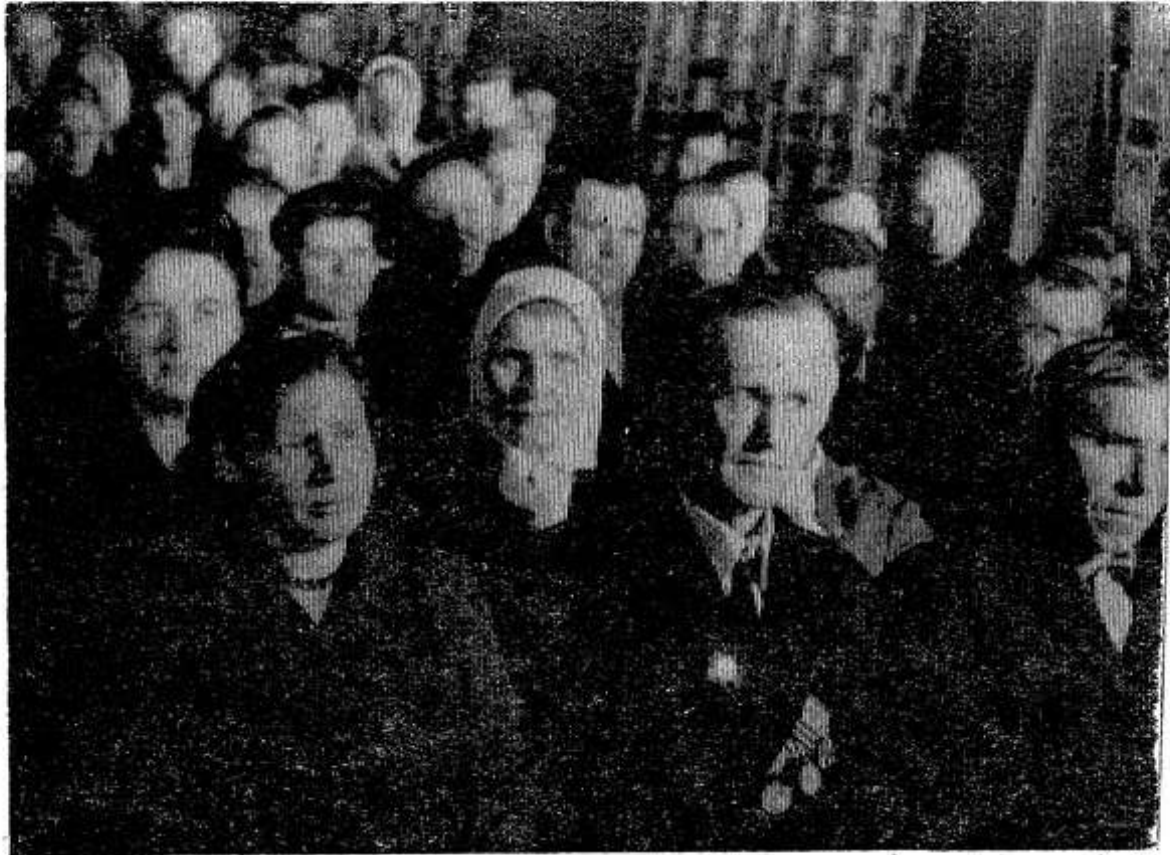
В зале заседаний.

— По итогам соревнования за год присвоить передовой бригаде, ферме почетное звание «Имени третьего Всесоюзного съезда колхозников».