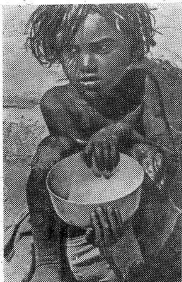
Империализм означает голод для миллионов людей. По статистике ООН 375 миллионов человек на земле живут на грани голодной смерти. Ежегодно от недоедания умирают 80 тысяч человек, то есть один человек в каждую секунду!

9.00 — Гимнастика для всех. 9.45 — Телевизионные новости. 10.00 — Музыкальная развлекательная программа. 10.30 — «Музыкальный турнир городов». Сочи — Оренбург. 11.30 — «Актуальные проблемы экономики». Щекинский эксперимент. Репортаж. 12.00 — В эфире — «Молодость». 1. «Дорогой опочков». Передача из Воронежа. 2. Концертная программа. Передача из Челябинска. 13.00 — Телевизионный народный университет. 1. Наука и ее роль в жизни общества. Периодизация и классификация наук. 2. «Понятие культуры». Понятие культуры в современной науке. Культура и природа. Две основные формы существования культуры. 14.30 — Телевизионные новости. 15.00 — «Москва — Улан-Батор». Телевизионная переписка. 16.00 — Телевизионные новости. 16.15 — Программа цветного телевидения. 1. Для де-