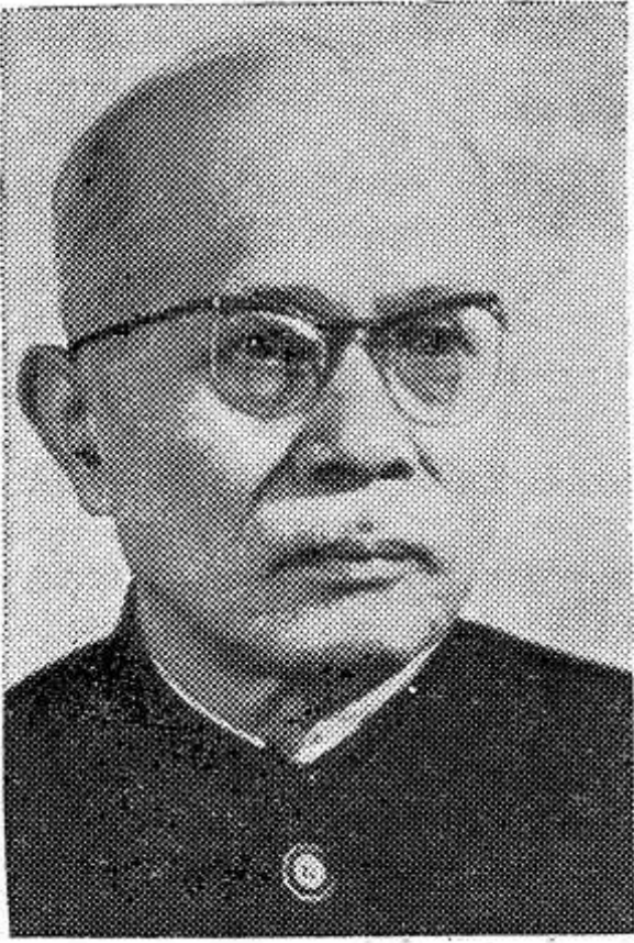
Президент Демократической Республики Вьетнам Тон Дык Тханг.