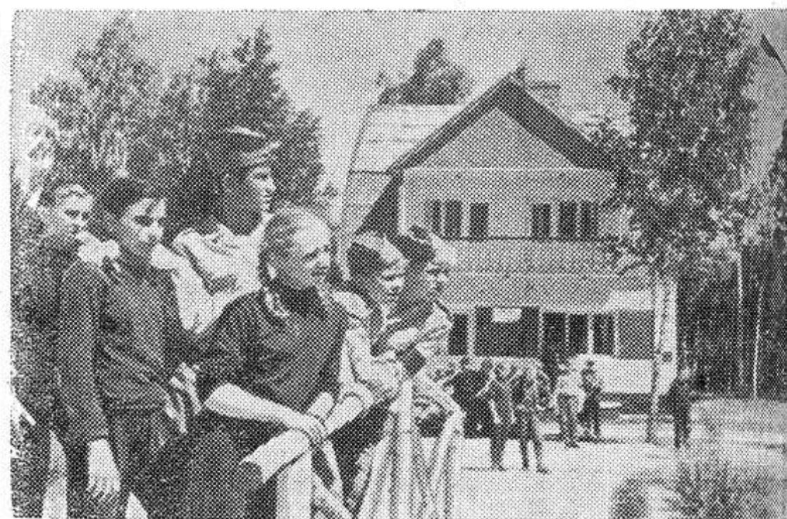
ВОЛЫНСКАЯ ОБЛАСТЬ. В Цуманском лесу, где в годы Великой Отечественной войны стояло партизанское соединение Героя Советского Союза Д. Н. Медведева, открыт музей партизанской славы. Его многочисленные экспонаты и документы рассказывают посетителям о славных делах народных мстителей, о жизни и боевом подвиге партизана-разведчика Героя Советского Союза Н. И. Кузнецова.