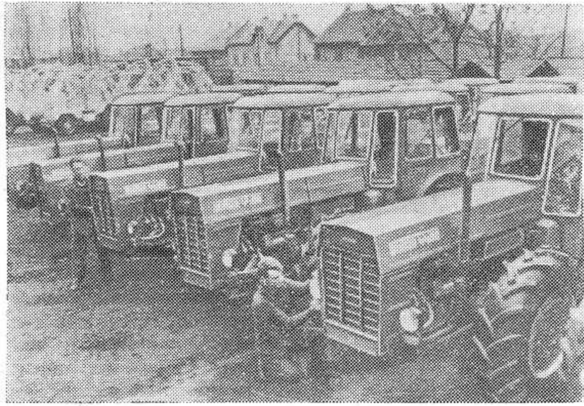
«Дутра-4400» — универсальные тракторы новой марки, серийное производство которых налажено на будапештском тракторном заводе «Красная звезда». Эти машины, которые успешно применяются на полях венгерских кооперативов и госхозов, экспортируются в разные страны мира.