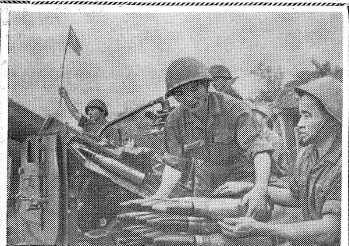
Американская военщина продолжает нарушать суверенитет и безопасность Демократической Республики Вьетнам. В разведывательных полетах участвуют сотни пилотируемых и беспилотных самолетов США. Зенитчики