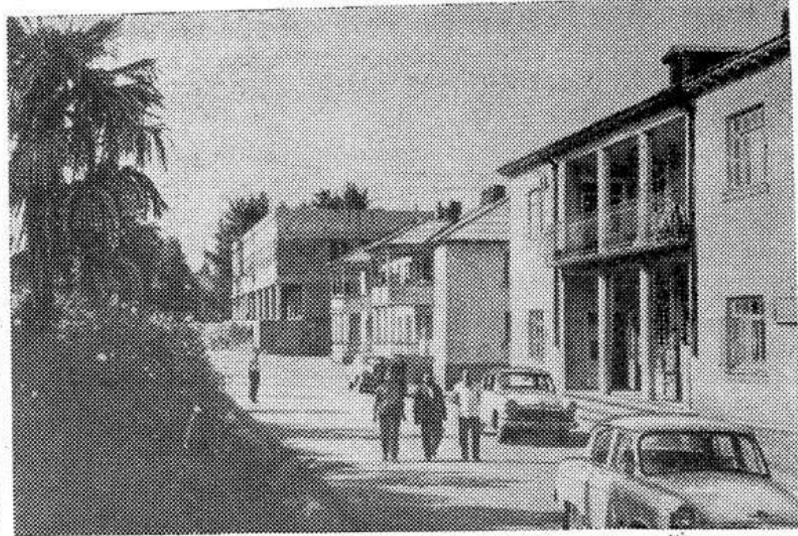
ГРУЗИНСКАЯ ССР. На Всесоюзный смотр-конкурс 1969 года на лучшую застройку и благоустройство колхозных и совхозных поселков представлены центральные усадьбы Лайтурского и Ингурского чайных совхозов и колхозные села Земо-Баргеби Гальского района и Нагомари Махарадзевского района. НА СНИМКЕ: улица имени Орджоникидзе центральной усадьбы Лайтурского чайного совхоза.