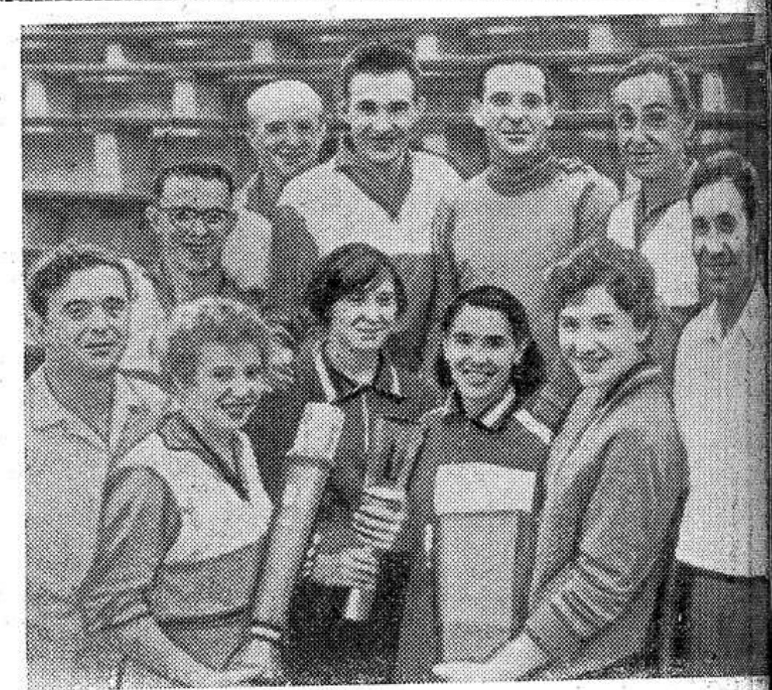
IX Всесоюзная спартакиада профсоюзов, посвященная 100-летию со дня рождения В. И. Ленина. На финальных соревнованиях среди сельских коллективов физкультуры в Краснодаре общее первое место по легкой атлетике занял коллектив спортсменов подмосковного совхоза «Белая дача».