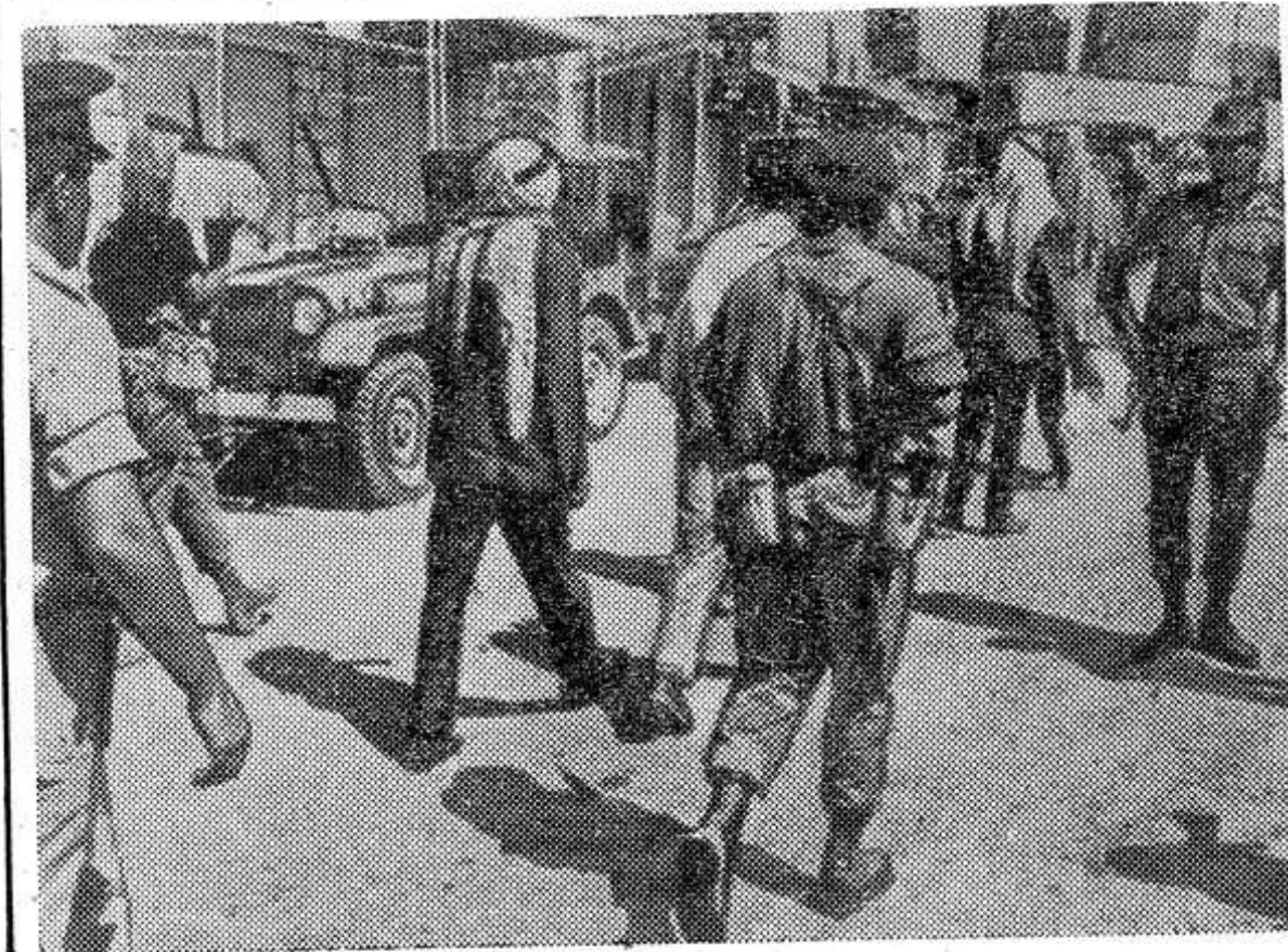
Израильские агрессоры продолжают бесчинствовать на оккупированных ими арабских территориях.

Подразделения Народных вооруженных сил освобождения нанесли минометный удар также по крупнейшему американскому военному комплексу в Ньячанге.