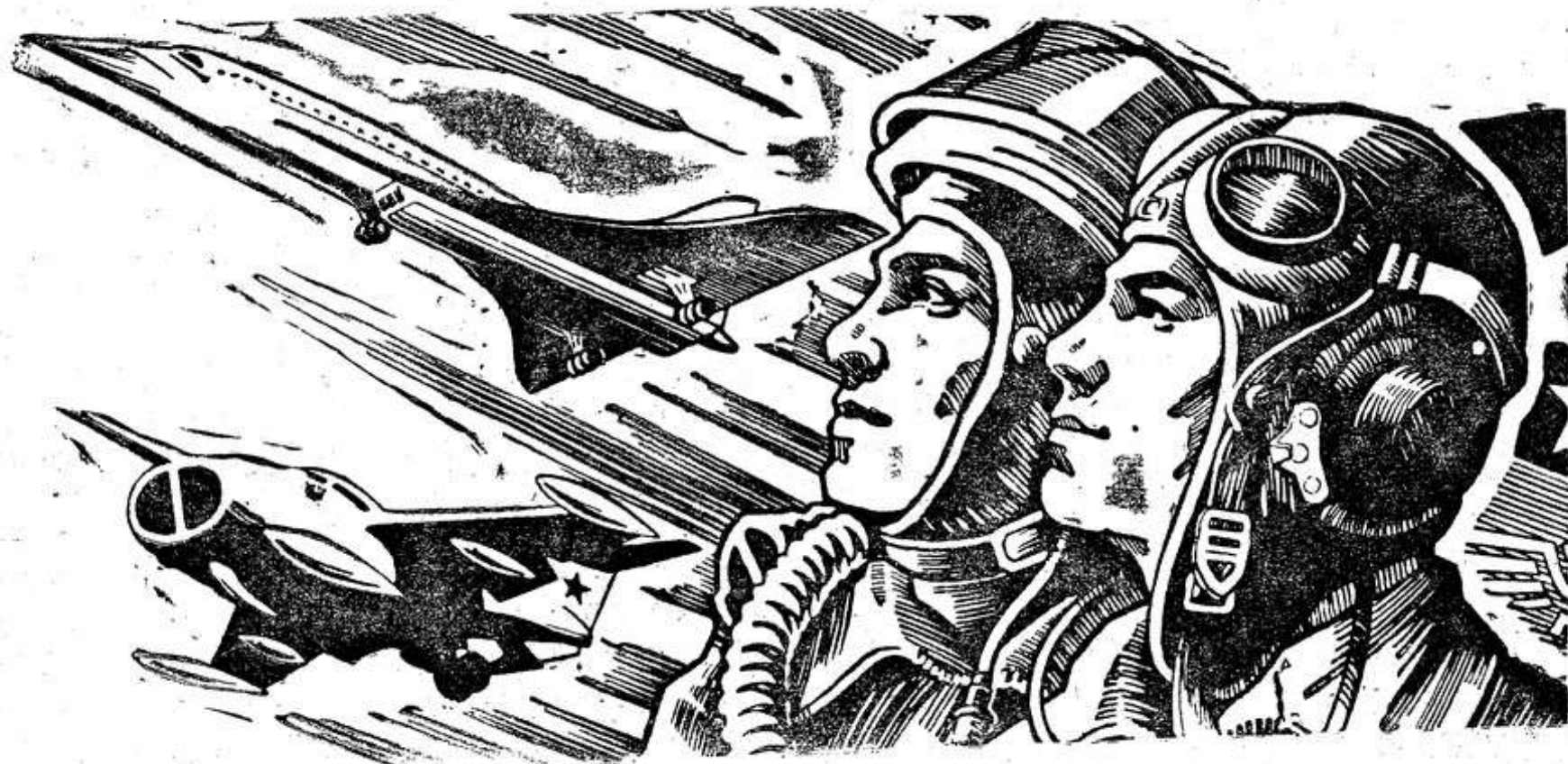
Рис. художника С. Гринько.