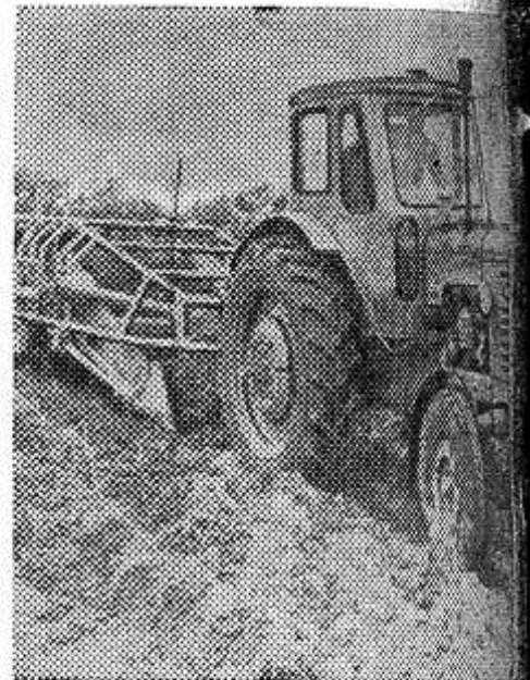
Коллектив ордена Ленина Ярославского моторного завода много лет оказывает практическую помощь труженикам села. В этом году здесь обязались собрать машины, которые много облегчат труд по уборке картофеля. НА СНИМКЕ: испытание картофелеуборочной машины на полях совхоза «Новый Север».

Л. Дроздецкая, секретарь парторганизации хлебокомбината.