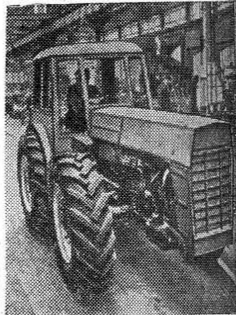
БУДАПЕШТ. На строящемся тракторном заводе «Вереск» освоено серийное производство тракторов «УЕ» мощностью 50 лошадиных сил. На снимке: новая машина покидает сборочный цех.

действующим программам. Немаловажный вопрос — кто будет преподавать после перехода на новые программы? Наиболее правильным было бы, чтобы это взяли на себя учителя русского языка, математики, биологии и географии восьмилетних и средних школ. Начав занятия с детьми на год раньше, они получат больше возможности для обучения их в средней школе на высоком уровне требований. Но все зависит от конкретных условий. Есть отдаленные начальные сельские школы, из которых едва ли удастся сразу вывести четвертые классы, и работать в них пока придется учителям начальных классов. Естественно, им необходимо серьезно подготовиться. (АПН).