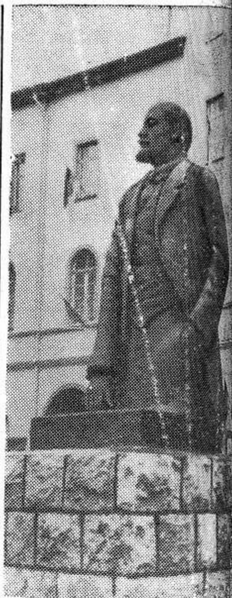
Германская Демократическая Республика. В городе Наумбурге (округ Галле) открыт памятник В. И. Ленину.