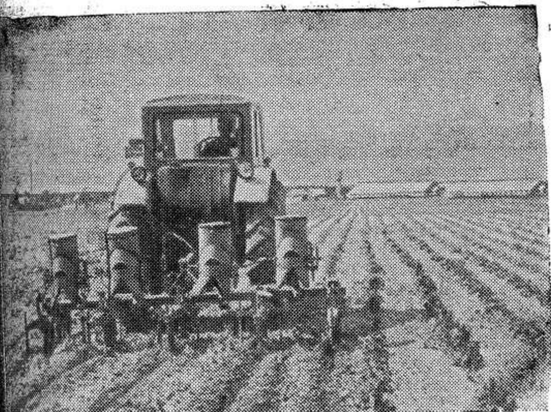
Брянская область является одним из крупнейших поставщиков картофеля. 10 гектаров отведено под эту