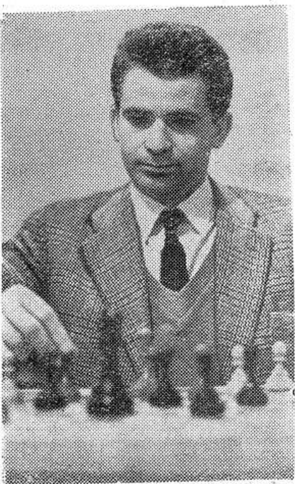
НА СНИМKE: гроссмейстер Борис Спасский, завоевавший звание чемпиона мира по шахматам.

роды». 10.30 — Для дошкольников и младших школьников. «Веселый городок». 11.00 — Для детей. «Занимательная азбука». 16.40 — Для детей. Мультипликационные фильмы. 17.10 — Телевизионные новости. 17.25 — К 25-летию освобождения Псковщины от фашистских захватчиков. Беседа. 17.45 — «Слава героям труда». Передача из Ленинграда. 18.55 — «Странная история Мигеля де Сааведра». Премьера телевизионного музыкального фильма по балету Минкуса «Дон-Кихот». 19.30 — Кубок СССР по футболу. 1-8 финала. В перерыве — новости. 21.15 — «Эстафета новостей». 22.30 — «Клуб любителей песни». 23.30 — «Эхо спортивного мира». Телевизионное обозрение. 24.00 — Только факты. Программа передач.