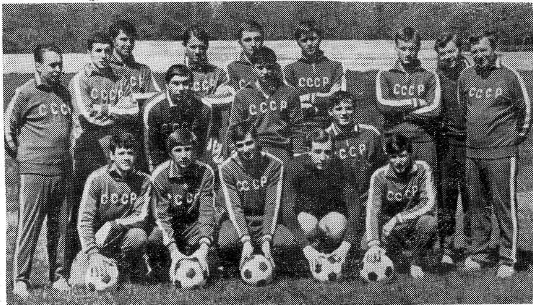
Сборная юношеская СССР — участница закончившегося в ГДР неофициального первенства Европы по футболу среди юниоров — заняла третье место и награждена бронзовыми медалями.