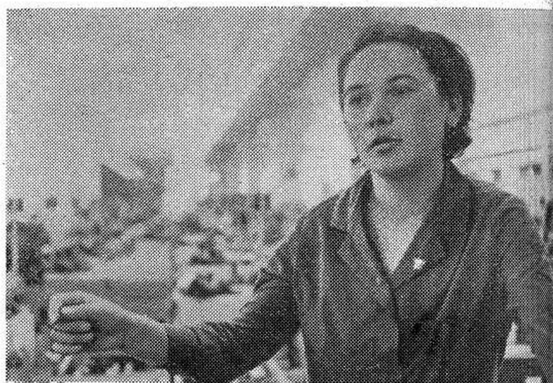
Работники легкой индустрии, встав на трудовую вахту в честь 100-летия со дня рождения В. И. Ленина, встречают свой праздник новыми успехами в производстве товаров широкого потребления. В этом году будут введены в действие 634 тысячи прядильных веретен, 7,280 ткацких станков, мощности по выпуску 77,4 миллиона штук трикотажных изделий. Выпуск кожаной обуви превысит 640 миллионов пар.