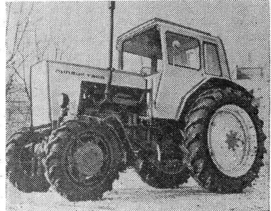
НА СНИМКЕ: трактор «Т-50А», который бу- дет выпускаться в 1970 году.