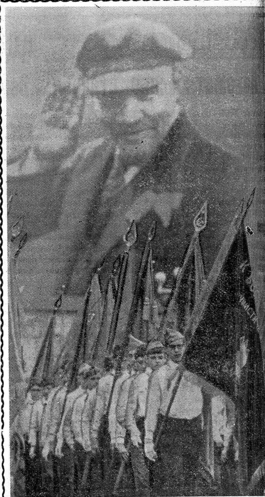
В свой праздник 23-миллионный отряд пионеров страны рапортует Родине об успехах в учебе, о своих трудовых пионерских делах. НА СНИМКЕ: идут знаменосцы.

В свой праздник 23-миллионный отряд пионеров страны рапортует Родине об успехах в учебе, о своих трудовых пионерских делах.