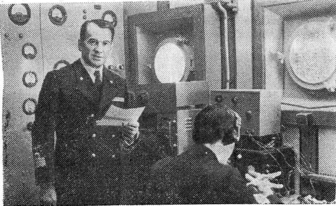
На киностудии «Мосфильм» советский режиссер Михаил Калитозов продолжает съемки фильма «Красная палатка». Это совместная работа советских и итальянских кинематографистов. Для участия в съемках в Москву прибыл известный итальянский киноактер Максимо Джеротти. Советские зрители помнят его по фильмам «Рим в 11 часов», «Утраченные грезы» и др. В новой картине «Красная палатка» он исполняет роль Романа капитана итальянского судна. НА СНИМКЕ: снимается эпизод фильма «В радиорубке». В роли капитана Романа — Массимо Джеротти.

БЕРЛИН. (ТАСС). Общественность Германской Демократической Республики расценивает установление дипломатических отношений между ГДР, с одной стороны, Ираком и Камбоджей, с другой, как новую победу последовательной миролюбивой политики рабоче-крестьянского государства, служащей делу мира и социального прогресса. ГДР имеет дипломатические, консульские, торговые и другие официальные представительства более чем в 50 странах мира, является членом различных международных организаций, торгует более чем со ста странами.