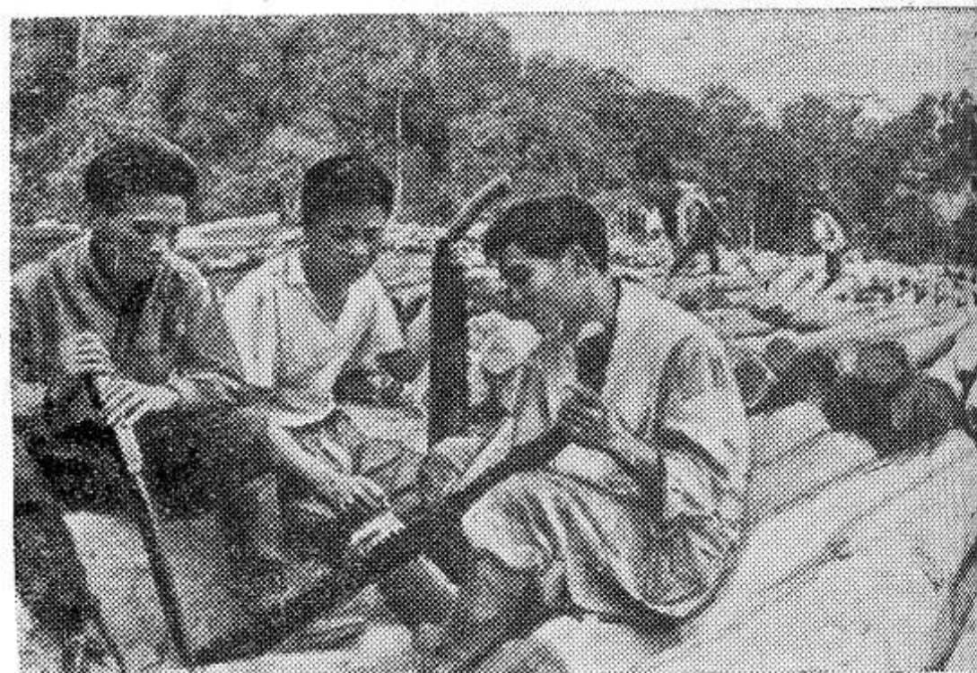
ДЕМОКРАТИЧЕСКАЯ РЕСПУБЛИКА ВЬЕТНАМ. На лесопосадках в Туалунге.

НА СНИМКЕ: обработка полей в районе Виньлин.