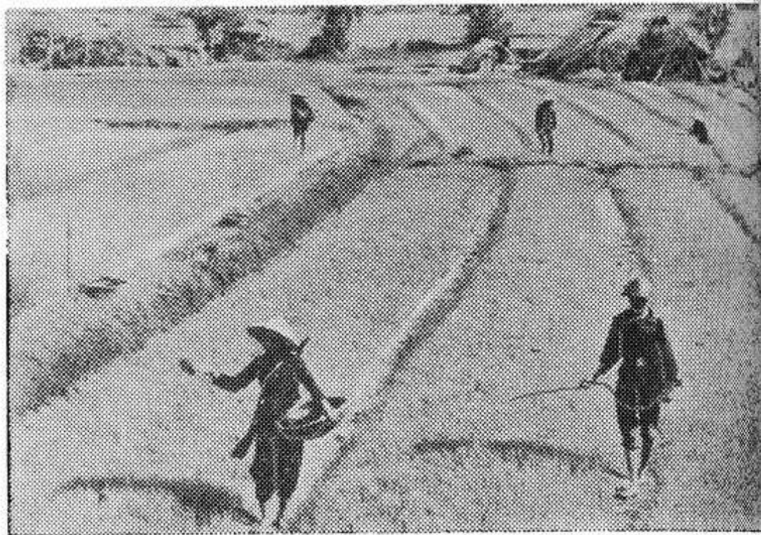
У земледельцев южных провинций ДРВ наступила горячая пора — на полях зреет весенний урожай риса. Крестьяне сельскохозяйственных кооперативов республики активно включились в производственное соревнование за успешное выполнение государственного плана 1969 года под лозунгом «Каждый работает за двоих».

НА СНИМКЕ: обработка полей в районе Виньлин.