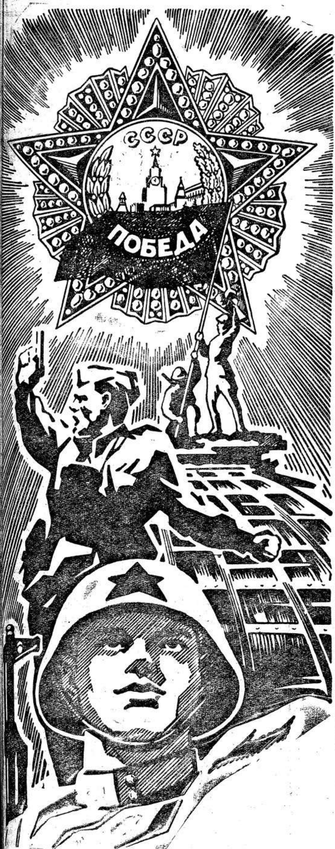
Плакат художника С. Прибыло.