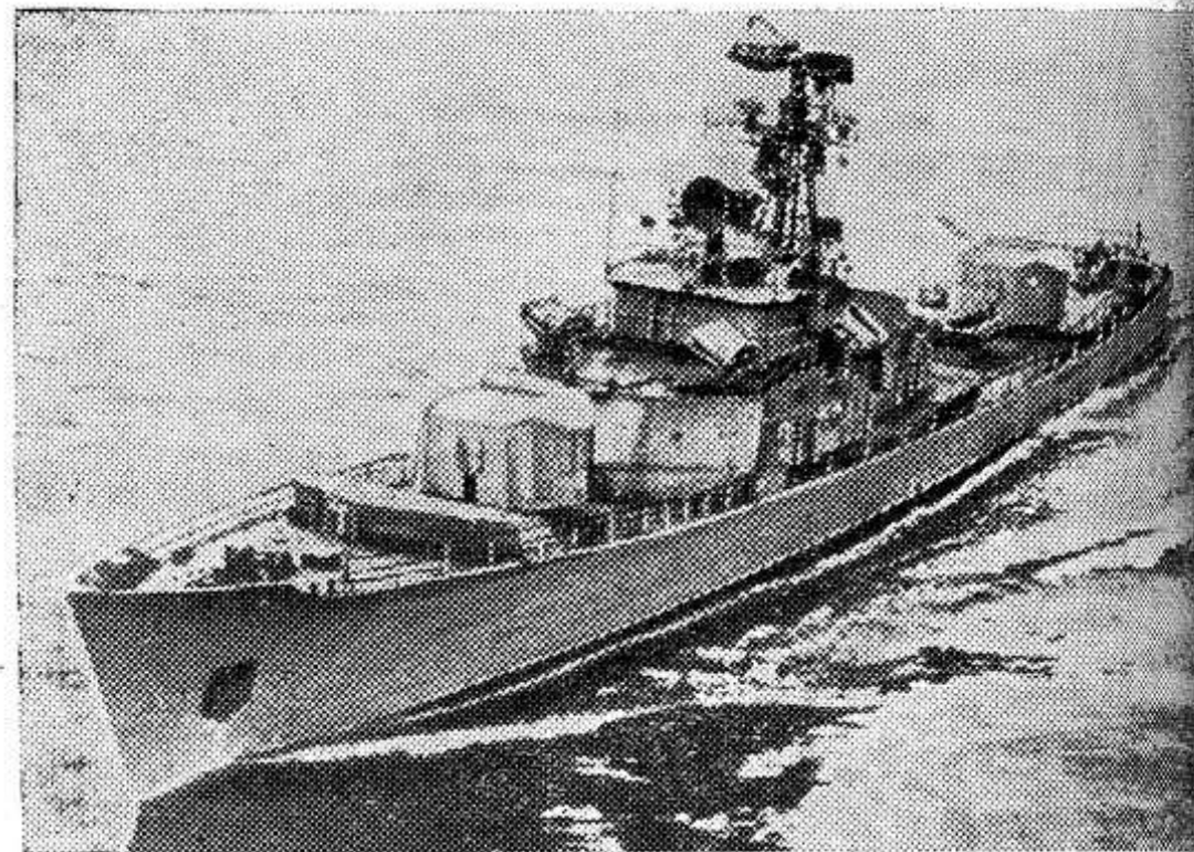
НА СНИМКЕ: Краснознаменный Северный Флот. Противодочный корабль ведет поиск подводной лодки «противника».