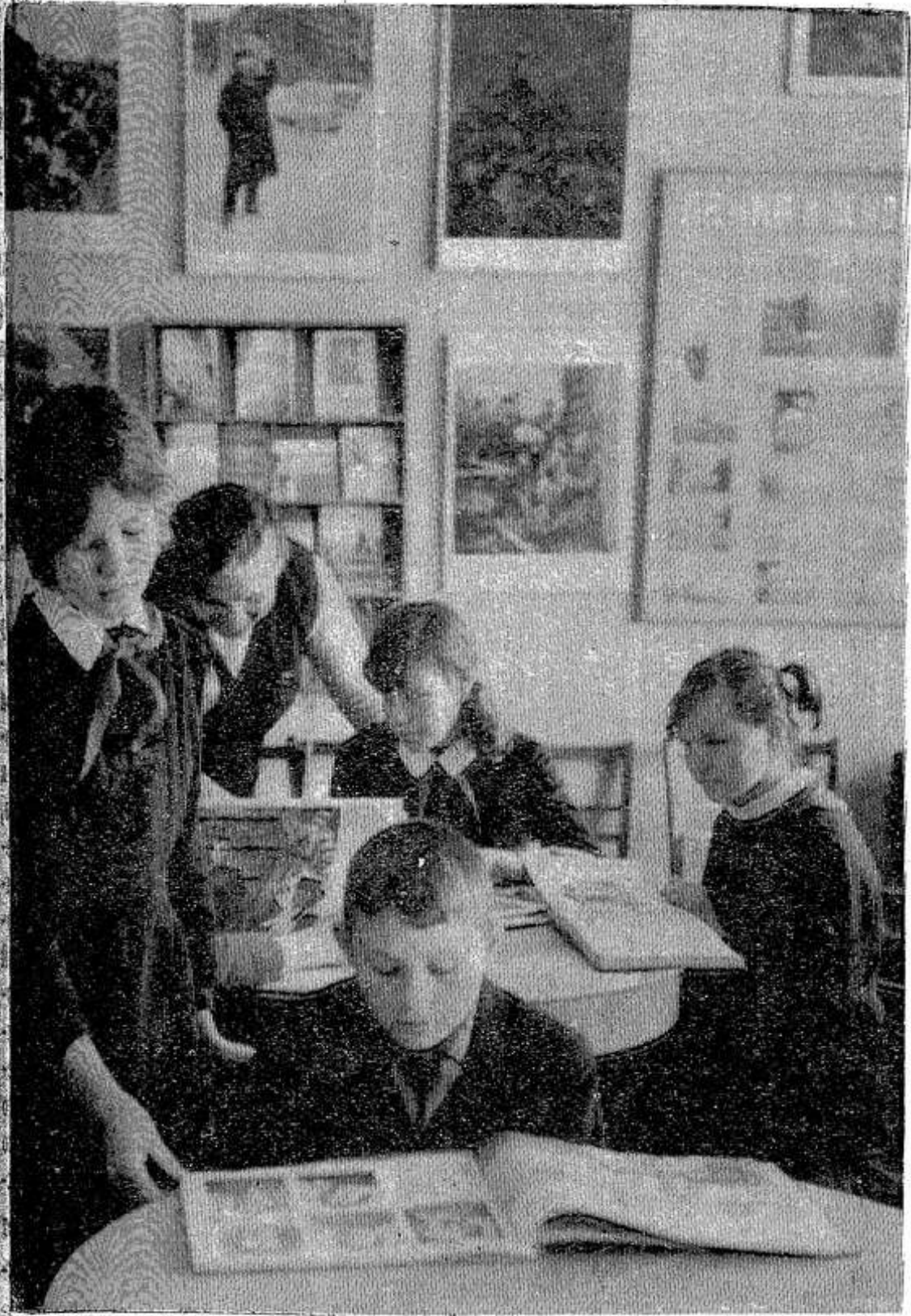
В ленинской комнате школы-интерната слабослышащих детей.

К 99-й годовщине со дня рождения В. И. Ленина