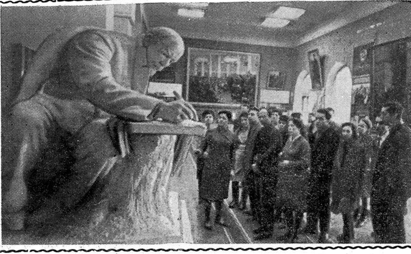
Образ вождя революции — Владимира Ильича Ленина — неиссякаемая тема в искусстве.

Почетными грамотами награждены и другие передовики соревнования.