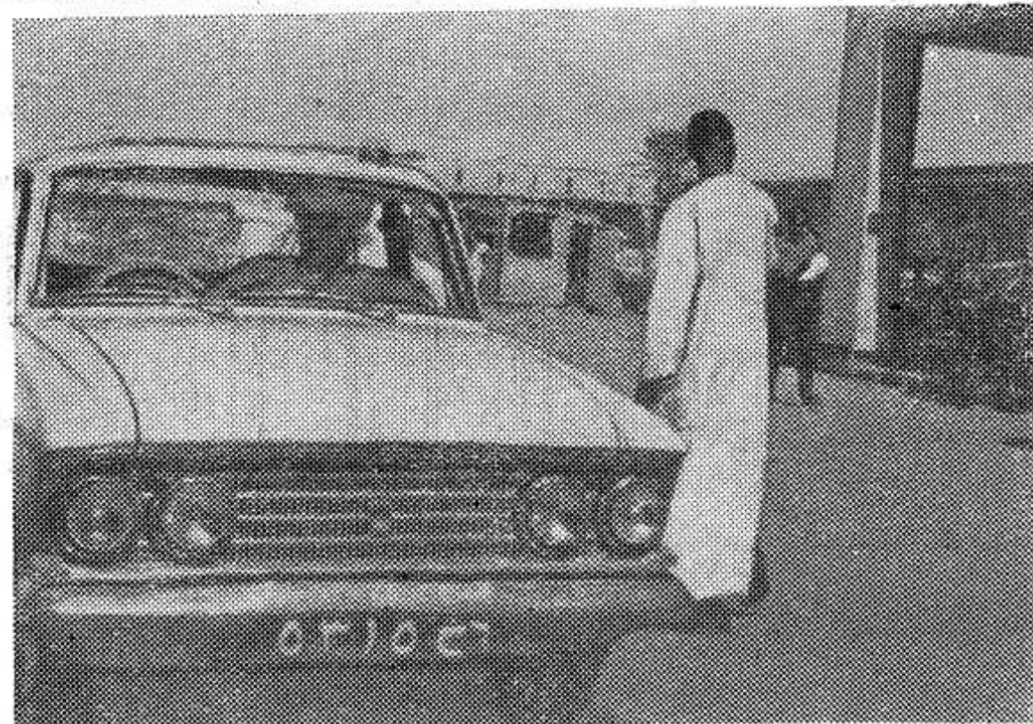
«Москвич-408» — эту небольшую, неприхотливую и экономичную машину можно увидеть в любом городе Судана. НА СНИМКЕ: «Москвич-408» на одной из улиц Хартума.