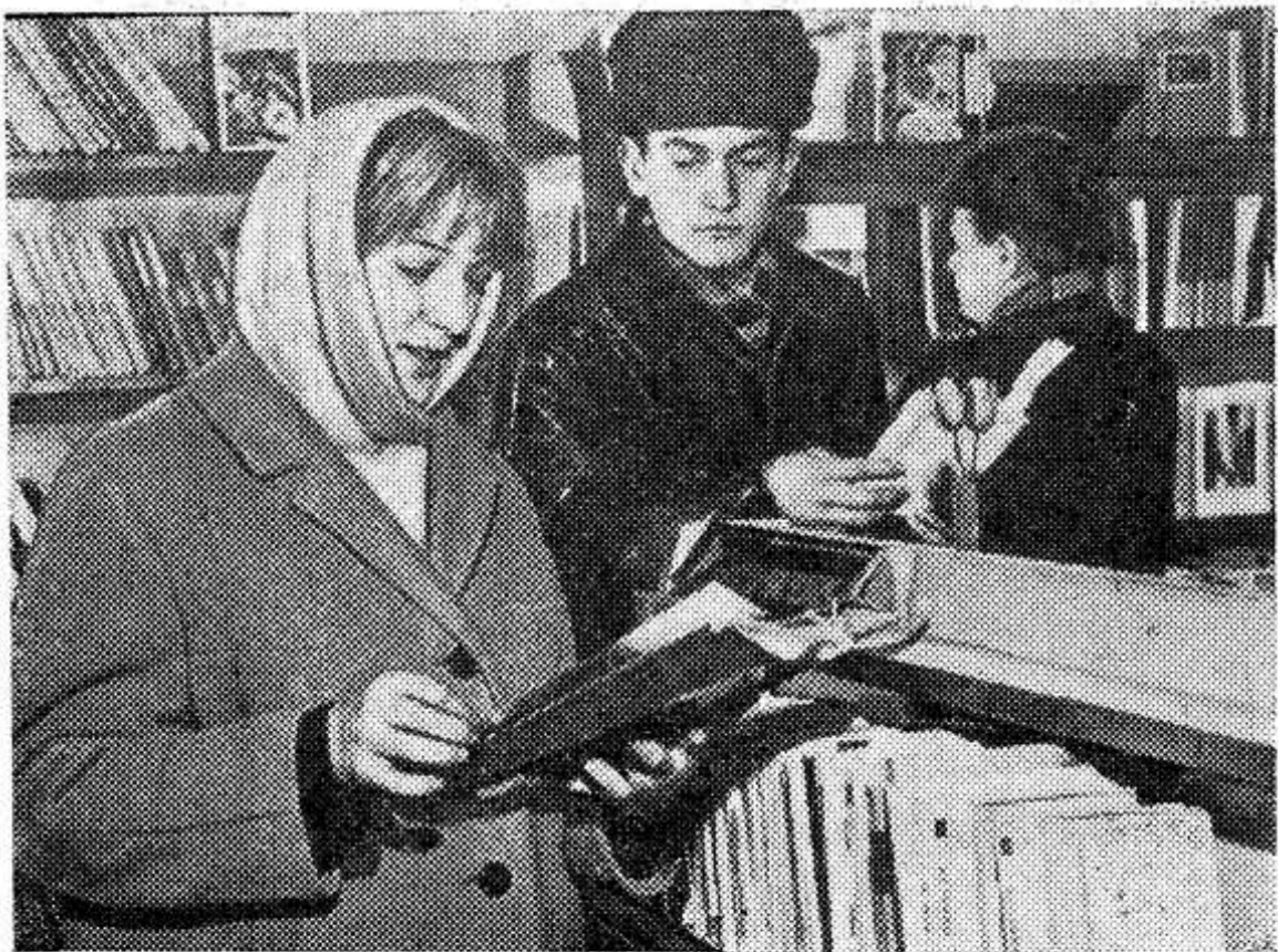
ЗАКАРПАТСКАЯ ОБЛАСТЬ. Большая тяга к книге у жителей горного села Вышково Хустского района. В местном книжном магазине имеется большой выбор политической, художественной, сельскохозяйственной литературы. Магазин — каждый

По обсужденному вопросу на собрании актива было принято постановление, в котором намечены практические меры, направленные на увеличение производства зерна и другой сельскохозяйственной продукции.