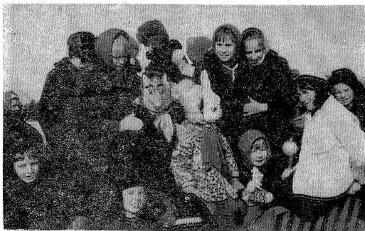
А веселее всех было детям.