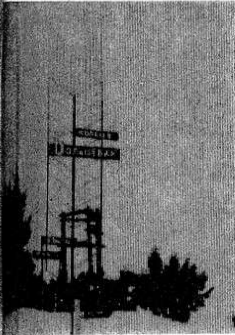
Отсюда начинается село Макушино.

Макушино. Старое русское село. Но когда идешь по его широким улицам, на каждом шагу чувствуешь следы обновления. Тракторы, комбайны, автомашины на полях. Добротные постройки — сельский Совет, клуб, восьмилетняя школа, библиотека, медпункт, магазин, почта, дом престарелых. Достаток в домах колхозников.