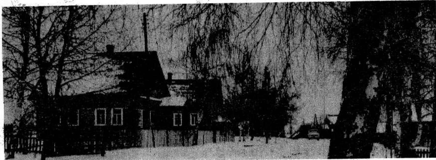
НА СНИМКЕ: одна из улиц села Макушино.