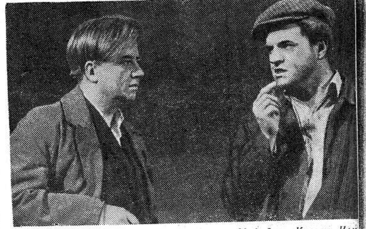
Государственный академический театр имени Моссовета показал премьеру драмы Ю. Чепурин «Мое сердце с тобой». В пьесе рассказывается о жизни села, ее людях, о проблемах колхозного строительства.