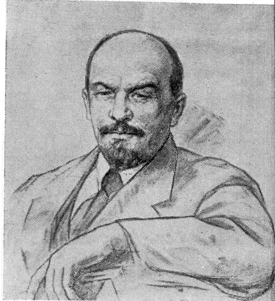
«Владимир Ильич Ленин в графике» — так называется выставка, открытая в Харьковском областном доме художественной самодеятельности. Авторы картин показывают вождя в разные периоды его жизни и деятельности.