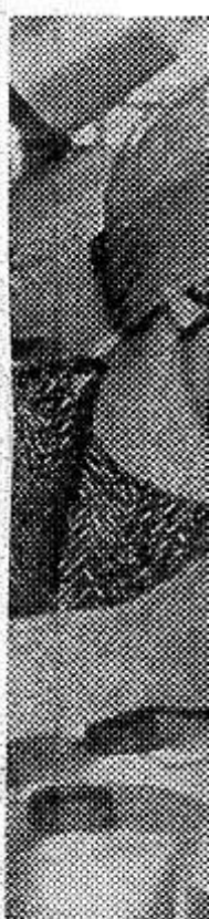
ЛЕНИН лектив зав дукции пер с 1967 год встречу 10 тили сверх ка, из кот шить один НА СН ударницы ненко, В. П Фото П

Ведется нас. Толь силами ной станц по осуще сива на ров. Боль на закры Чтобы пользован необходим мические мне и хоч Лен у принесит пример, в реализаци ло 158.78