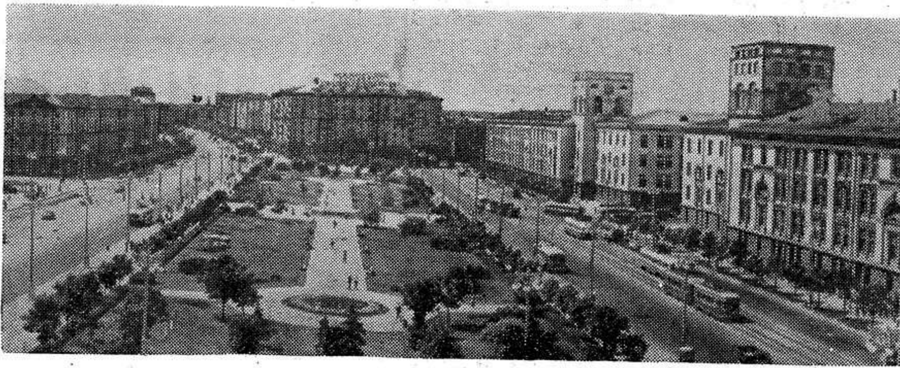
Столица республики — Минск. Площадь Якуба Коласа.