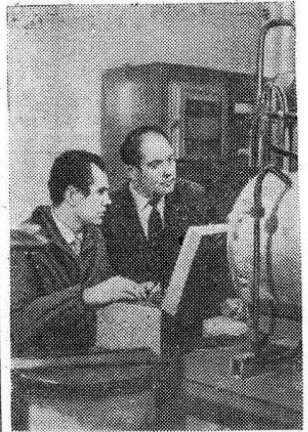
Как продлить сроки хранения свежих фруктов без ущерба их питательным и вкусовым качествам? Ответ на этот вопрос дают научные сотрудники Института газа АН УССР (Киев). Они разработали специальный генератор контролируемой газовой среды, использование которого позволяет в 2—3 раза увеличить сроки хранения плодов.

Коммунисты этих совхозов намечили конкретные меры по повышению урожайности, разработали социалистические обязательства на следующий год.