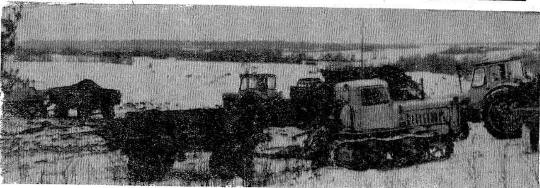
На вывозке торфа в колхозах и совхозах района занято два механизированных отряда ММС.