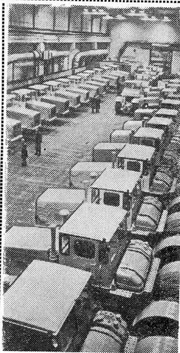
На октябрьском Пленуме ЦК КПСС, посвященном вопросам сельского хозяйства, Генеральный секретарь ЦК КПСС Л. И. Брежнев сказал: «...В ближайшие годы надо расширить также выпуск на Ленинградском Кировском заводе мощных колесных тракторов К-700, которые хорошо зарекомендовали себя, особенно в степных районах». Кировцы восприняли эти слова, как программу действий. Коллектив завода уже в этом году увеличил выпуск 220-сильных машин на 25 процентов. Здесь создан поточный выпуск тракторов. Ежедневно с главного конвейера предприятия сходят тракторы, которые отправляются в совхозы, колхозы и целинные районы нашей Родины. НА СНИМКЕ: тракторы К-700, готовые к отправке.