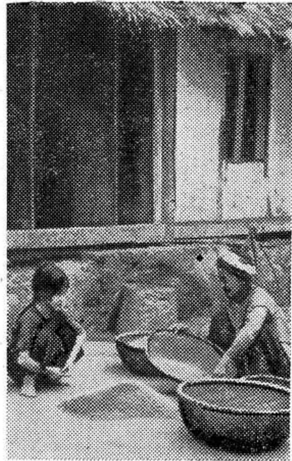
ДЕМОКРАТИЧЕСКАЯ РЕСПУБЛИКА ВЬЕТНАМ (провинция Хаобинь). Просеивание риса для домашних заготовок. Дочь пока только приглаждается к ловким движениям матери.

В своих выступлениях участники совещания выразили полное согласие с решениями ноябрьского пленума ЦК КПЧ и с главными задачами деятельности партии. Отмечалась необходимость обратить внимание на вопросы экономической и кадровой политики и позитивного партийного воздействия на средства массовой информации, равно как и на развитие традиционных дружеских связей с СССР и другими союзными социалистическими странами.