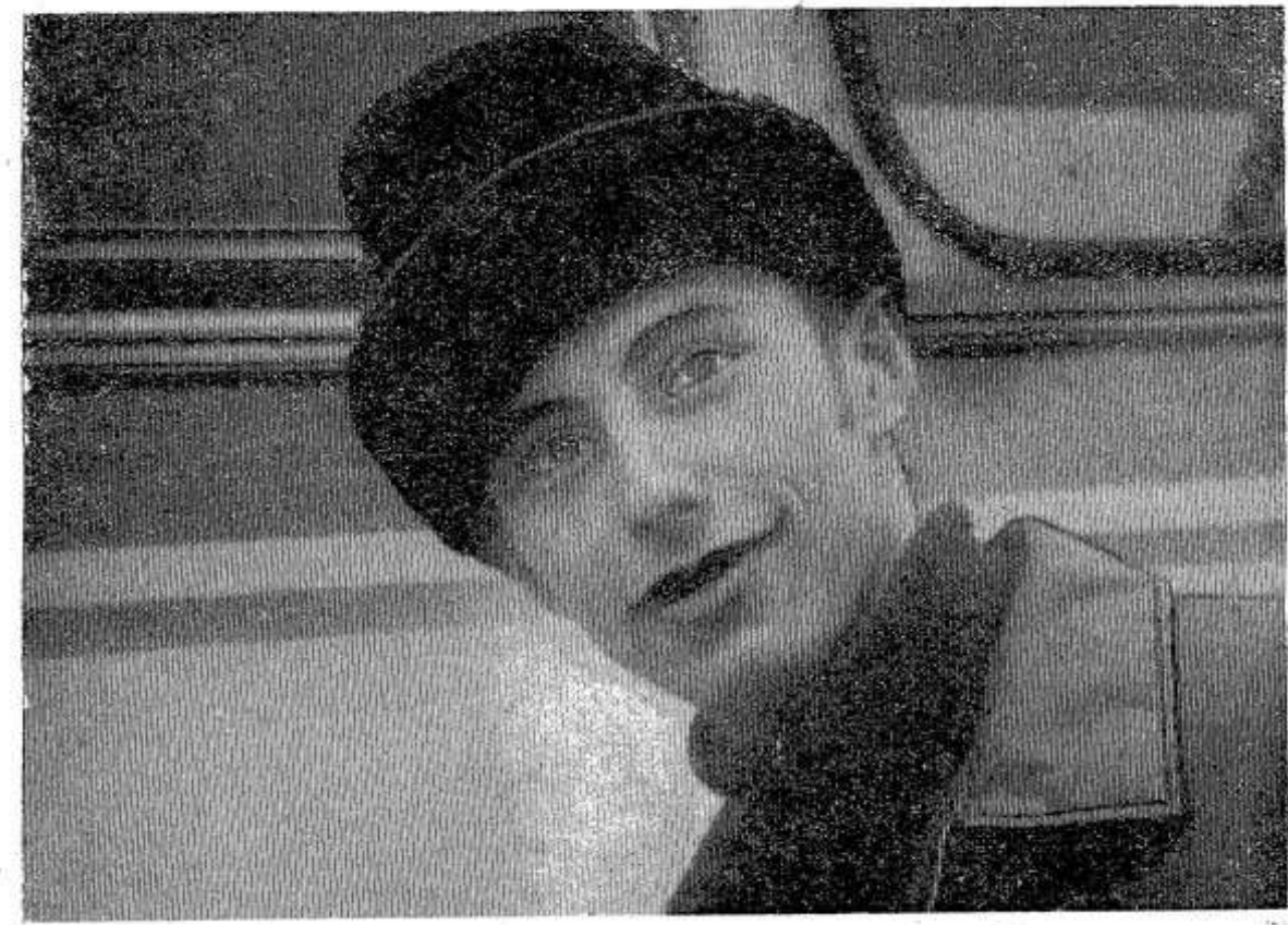
В автоколонне его знают не только как дисциплинированного шофера, но и как вожака молодежи, спортсмена.

С большим вниманием прослушали собравшиеся лекцию «О международном положении», которую прочитал член общества «Знание» Л. Я. Черкасский (г. Москва).