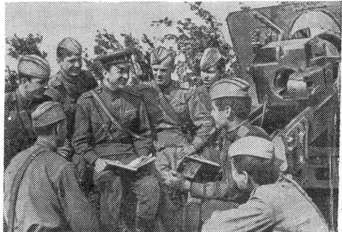
Коротки передышки на тактических учениях. В эти минуты воины собираются вместе, чтобы обсудить результаты первых стрельб. Сегодня у них хорошее настроение — все снаряды легли точно в цель.