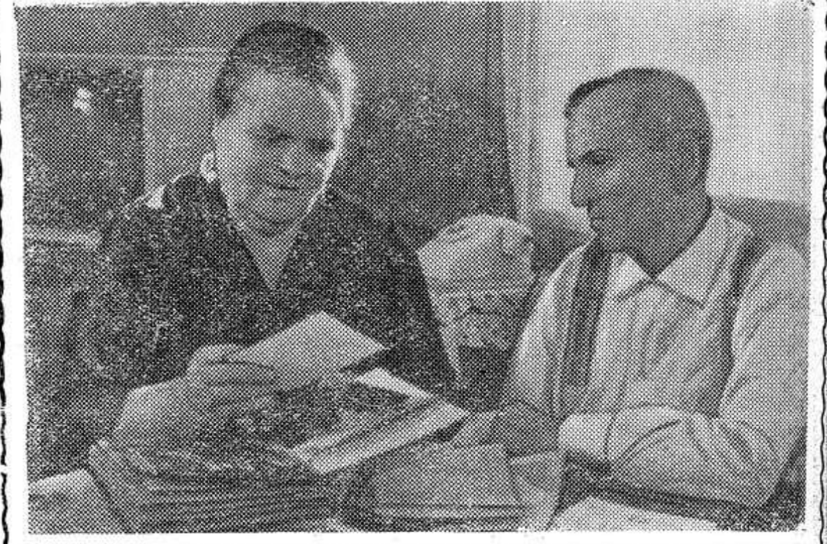
По следам наших выступлений