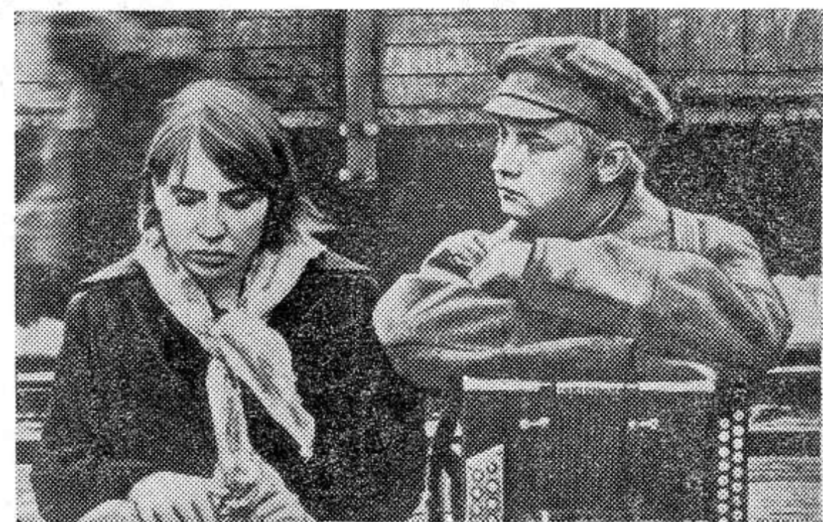
Кадр из художественного фильма «В огне брода нет»: Тая Теткина — артистка Инна Чурикова, Алеша — артист Михаил Кононов. Кинокартина по-

Как и прежде, в журнале представлены все без исключения отрасли производства. Однако изменилась направленность материалов. Основные проблемы сельского хозяйства, передовой опыт,