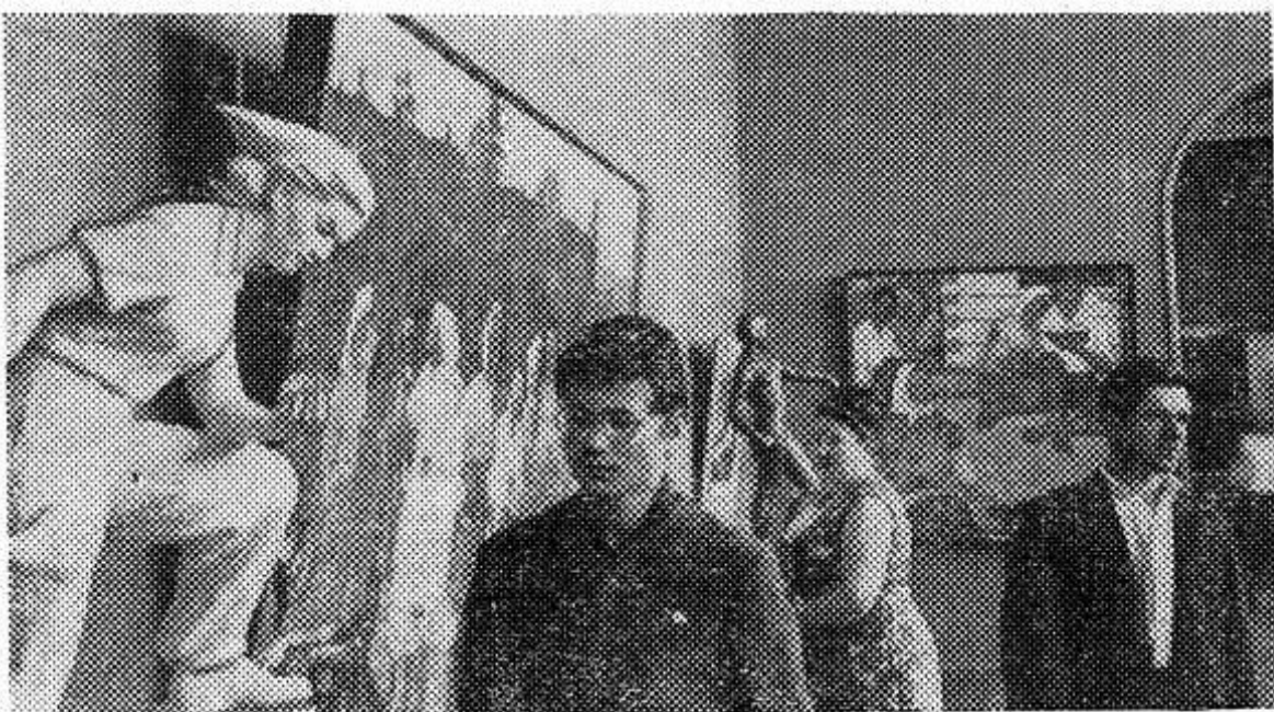
МИНСК. В Государственном художественном музее БССР открылась республиканская выставка, посвященная 50-летию ВЛКСМ. На ней представлено около 200 работ, созданных за последние годы белорусскими художниками. Экспонаты выставки рассказывают о славных

В повседневных заботах, преданных хлопотах подготовка учреждений культуры к зиме отодвигается на второй план. И это должно встревожить партийные организации, работников сельских Советов, всю общественность.