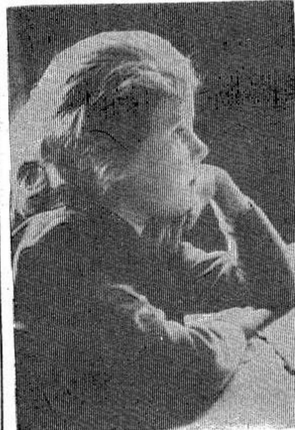
Первый в жизни урок.