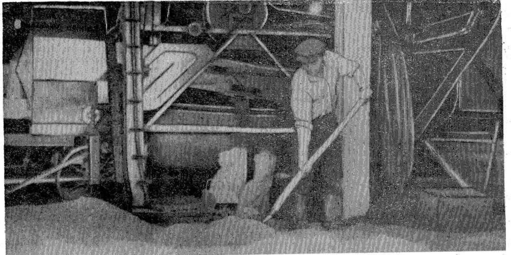
Полеводы и механизаторы колхоза «Родина» вовремя убрали озимые с 220 гектаров. Одновременно с уборкой шла сдача зерна государству. Озимые убраны, но на колхозном зернотоке по-прежнему