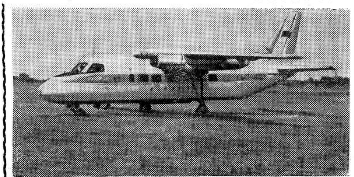
На зеленом поле стоит готовый к взлету новый самолет (на снимке). Создан он в конструкторском бюро под руководством Г. М. Бериева и предназначен для обслуживания местных авиатрасс. В салоне 14 кресел для пассажиров. Газотурбинная машина имеет два мощных двигателя и развивает крейсерскую скорость — 480 километров в час. За счет повышенной энерговооруженности шасси с шинами низкого давления и малой удельной нагрузки самолет может эксплуатироваться на грунтовых площадках с длиной летного поля 600 метров.