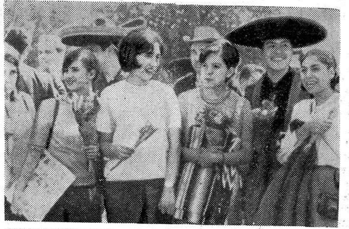
НА СНИМКЕ: посланцы молодежи стран Латинской Америки в столице фестиваля.