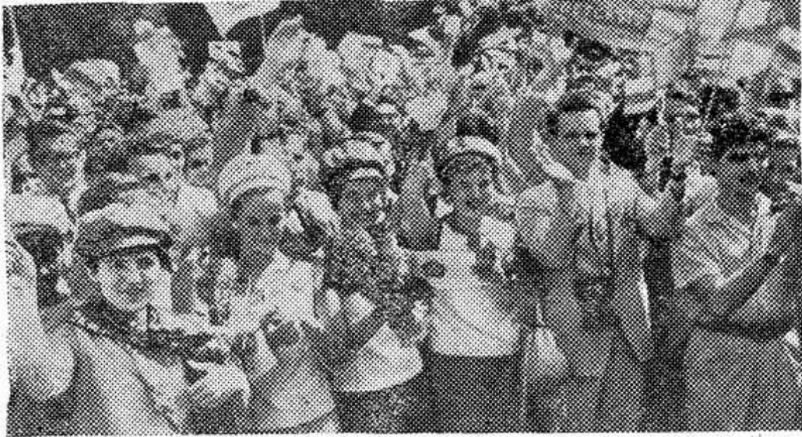
НА СНИМКЕ: советская делегация в столице фестиваля.